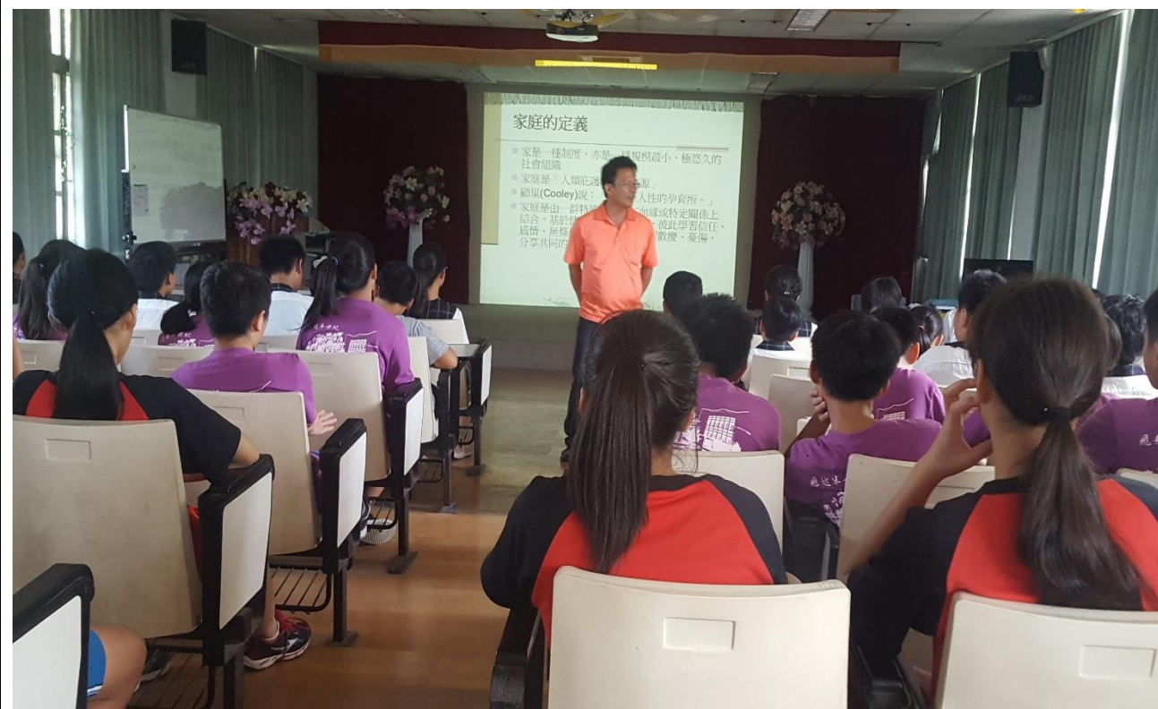
透過週會進行家庭教育宣導