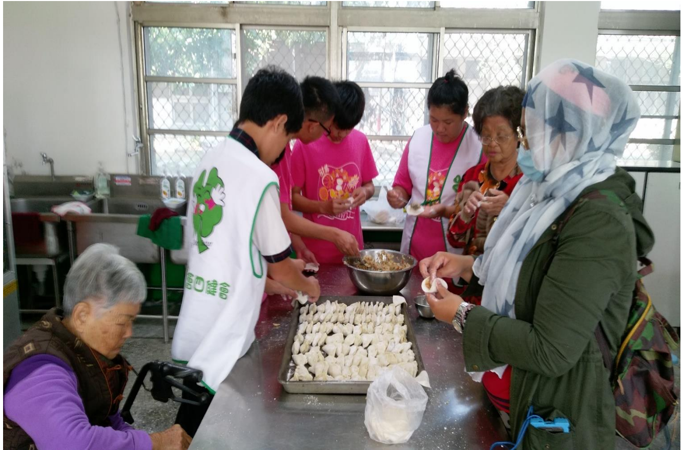
結合社區辦理老人共餐活動 增進祖孫情