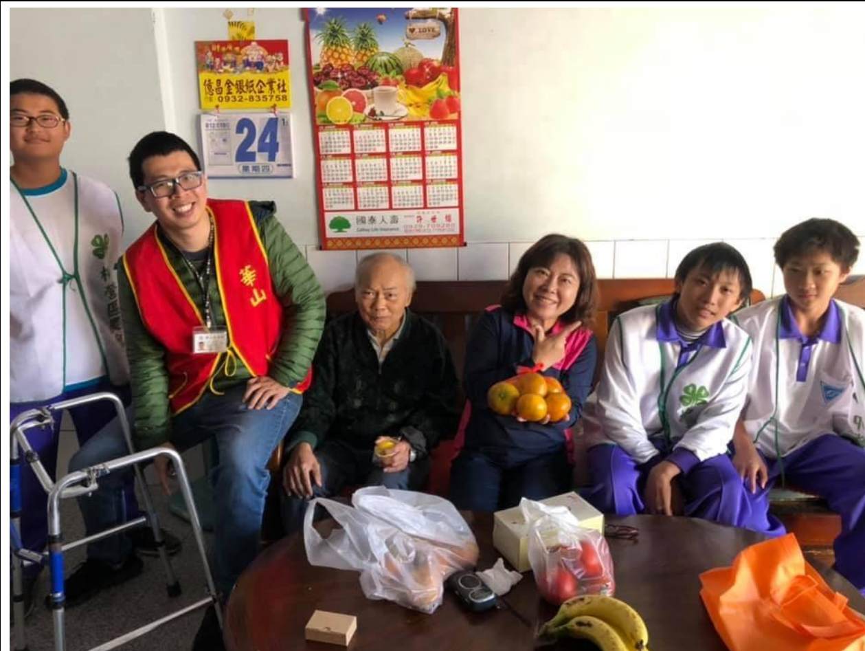
結合華山基金會辦理關懷老人服務活動 促進學生對長者的關心