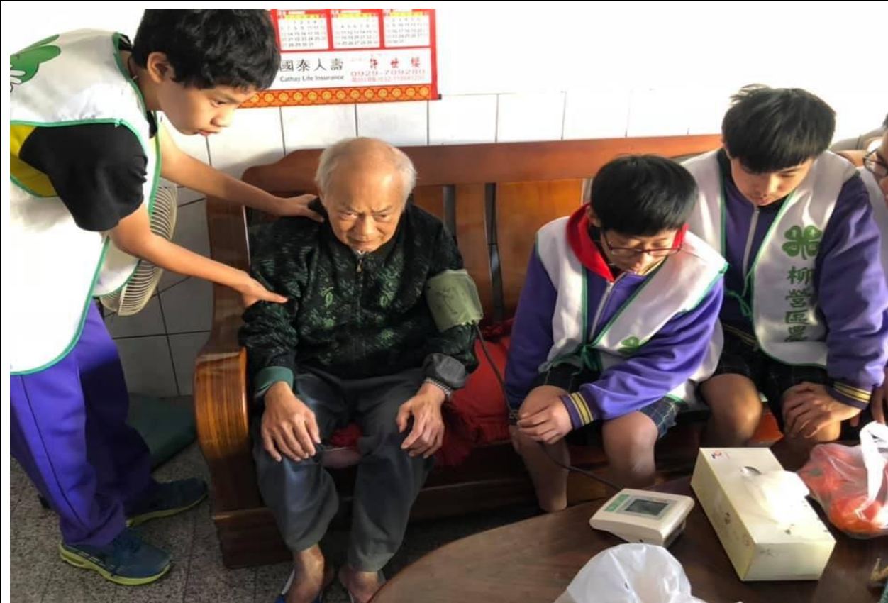
結合華山基金會辦理關懷老人服務活動 促進學生對長者的關心