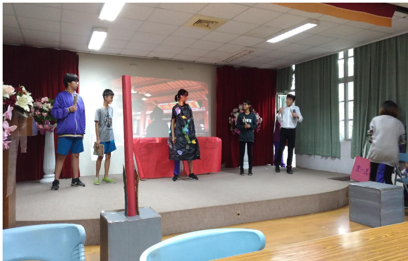
透過戲說查畝營戲劇比賽讓學生認識父母家族生活的社區文化