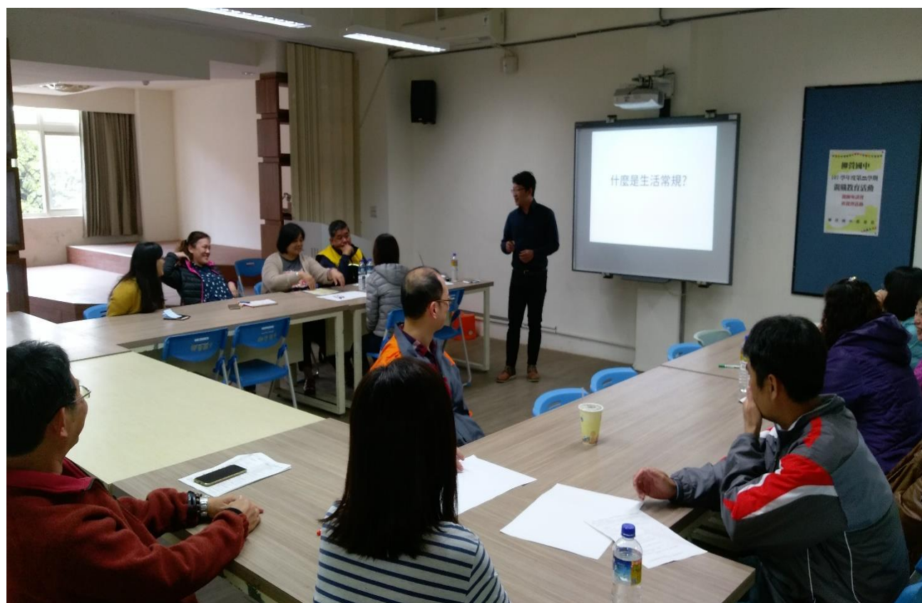
辦理班親會專題講座提升家長親職教育之素養