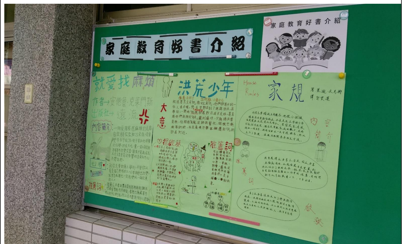
利用佈告欄介紹家庭教育好書---請學生製作家庭教育好書介紹海報。