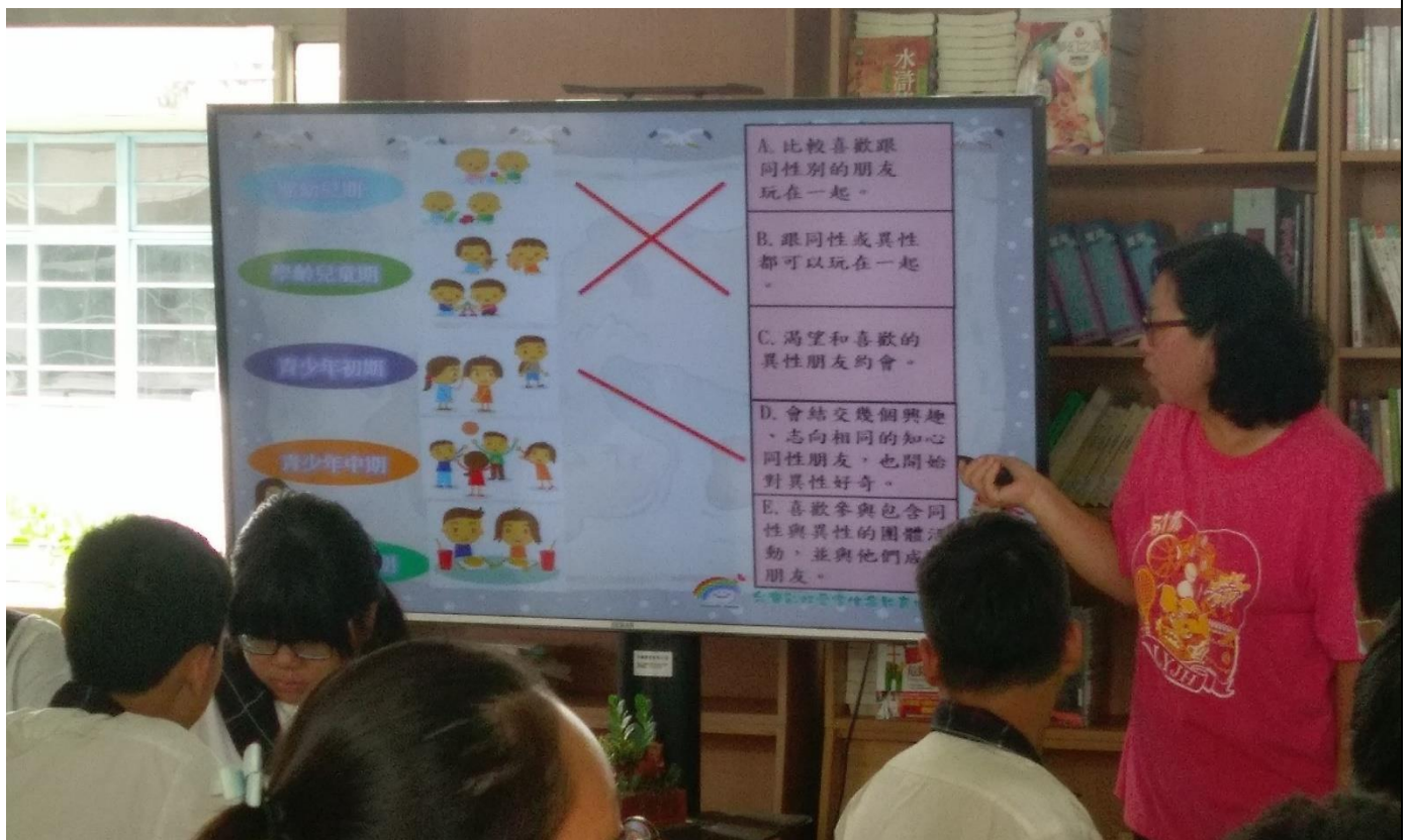
透過彩虹媽媽以說故事的方式引導學生了解家庭要如何正確組成