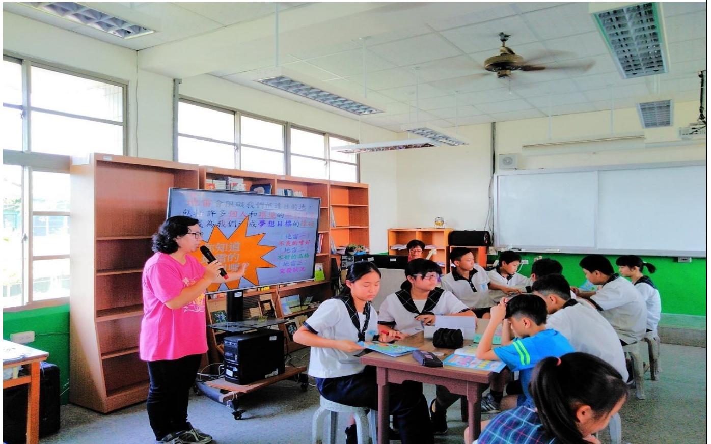
透過彩虹媽媽以說故事的方式引導學生了解家庭要如何正確組成