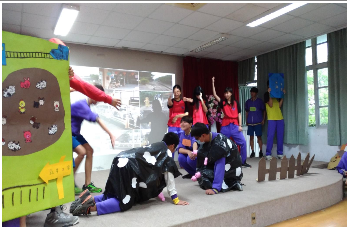
透過戲說查畝營戲劇比賽讓學生認識父母家族生活的社區文化