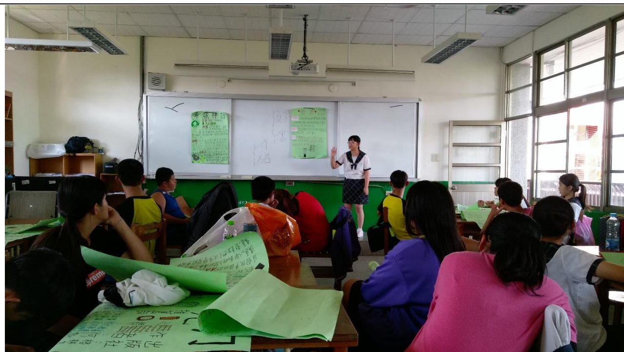
透過閱讀活動讓學生介紹家庭教育好書及分享心得