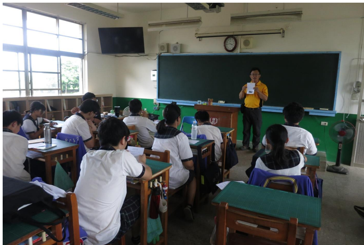
到班級進行宣導 4128185 諮詢專線促進學生的認識