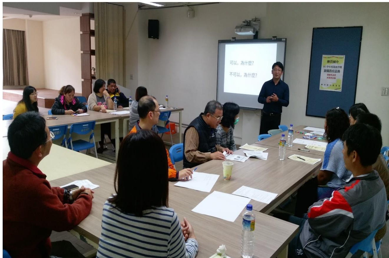
辦理班親會專題講座提升家長親職教育之素養