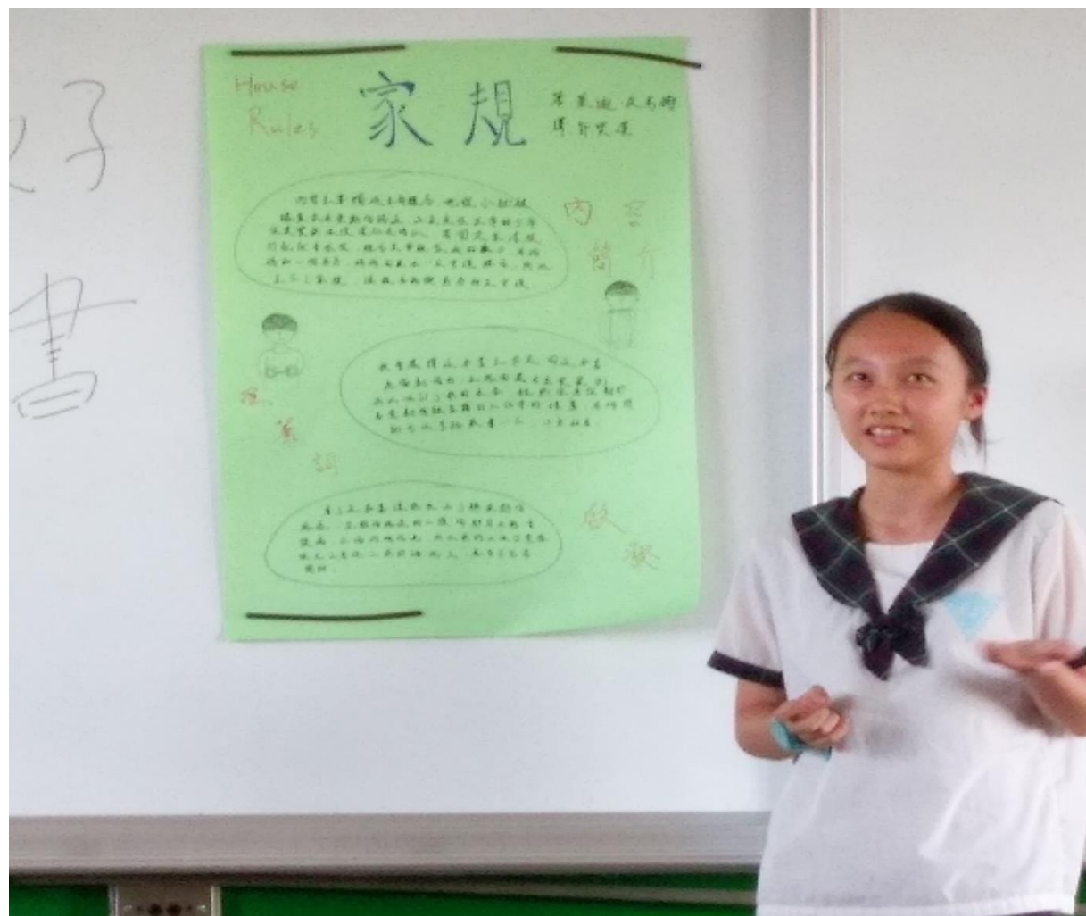
透過閱讀活動讓學生介紹家庭教育好書及分享心得