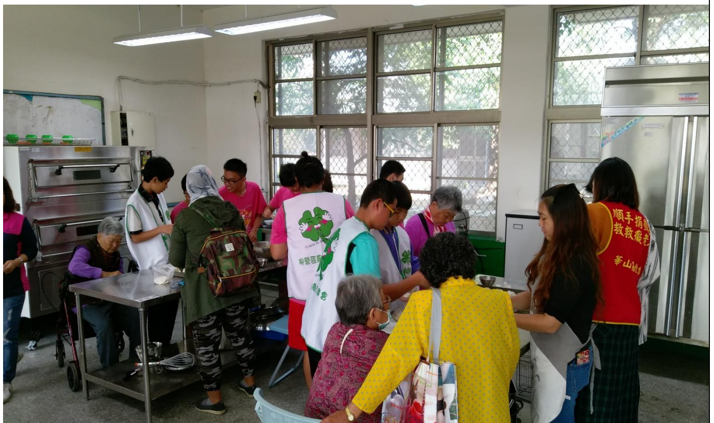
結合社區辦理老人共餐活動 增進祖孫情