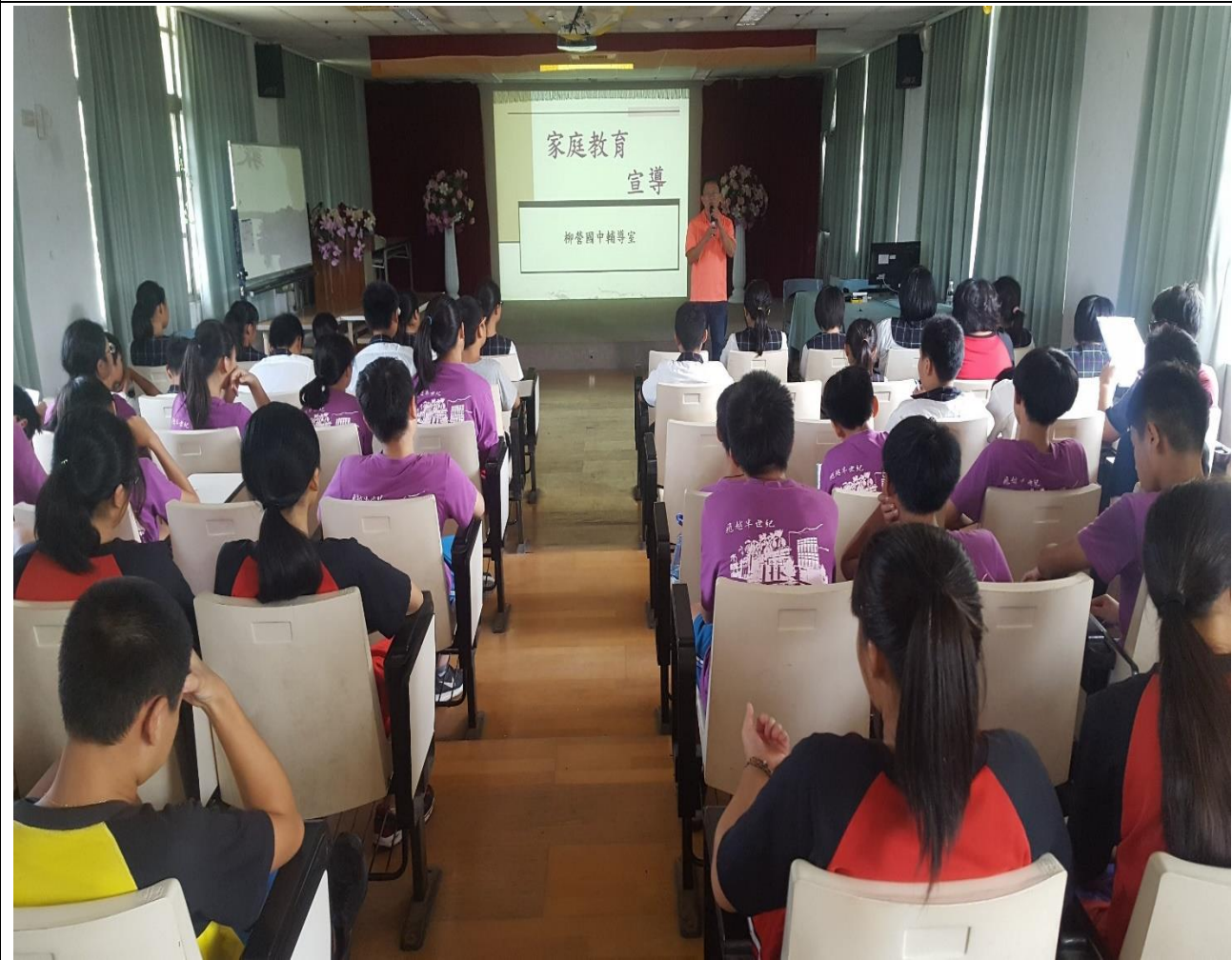
透過週會進行家庭教育宣導