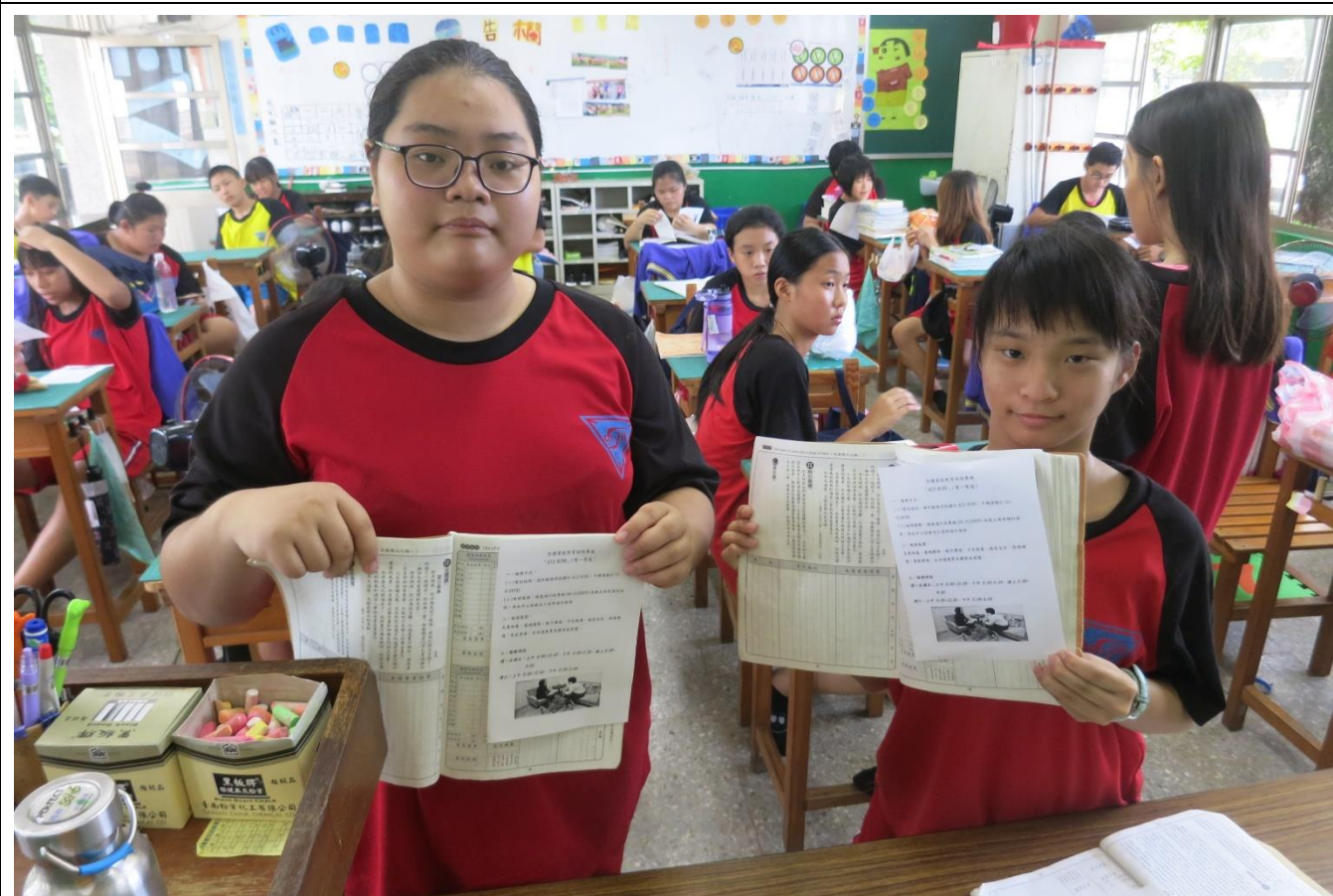
利用聯絡簿進行宣導---請學生將 4128185 諮詢專線文宣張貼在聯絡簿上提供家長了解。