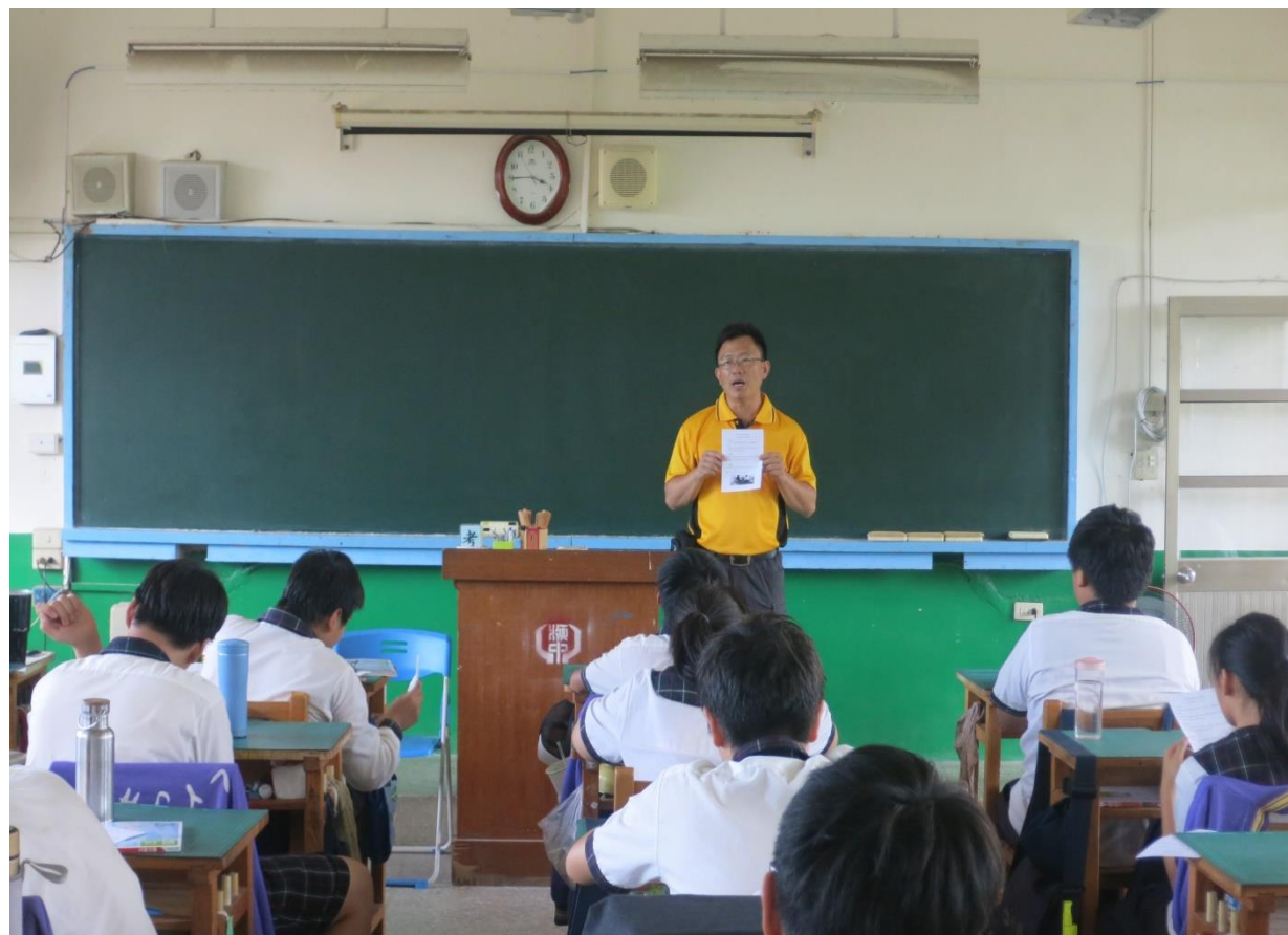
到班級進行宣導 4128185 諮詢專線促進學生的認識