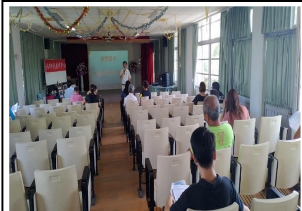
介紹技藝教育學程