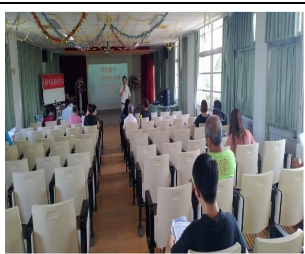
說明如何運用生涯發展紀錄手冊來引導學生了解自己的專長及興趣