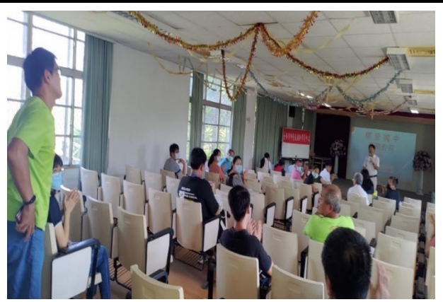
講師與教師互動分享經驗