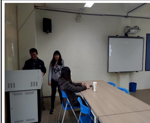
說明九年級學生志願選填試探後輔導