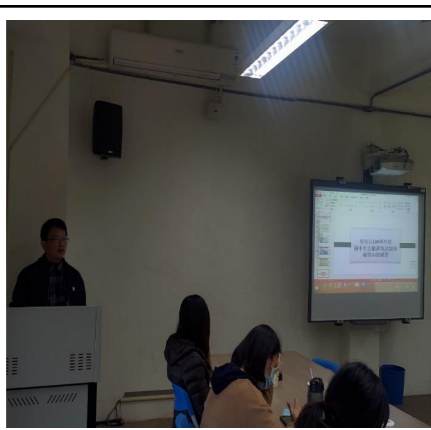
說明適性輔導理念