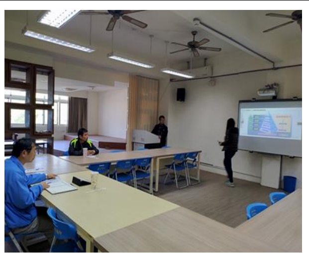
講師與教師互動分享經驗