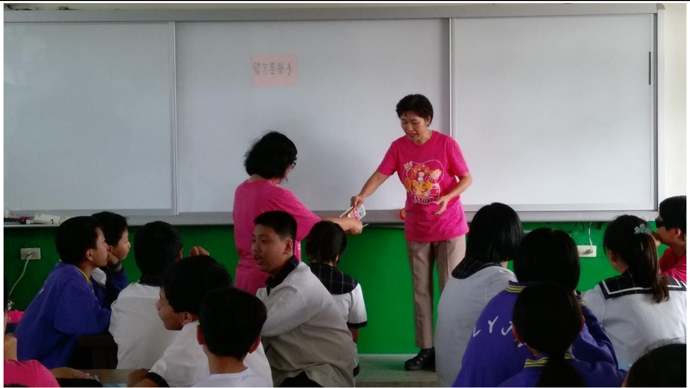
老師示範天生我材必有用,每人都有自己的長處