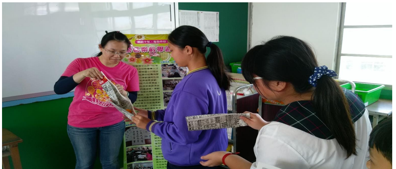
老師與學生實際參與活動,去體會每個人的長處及自我的了解