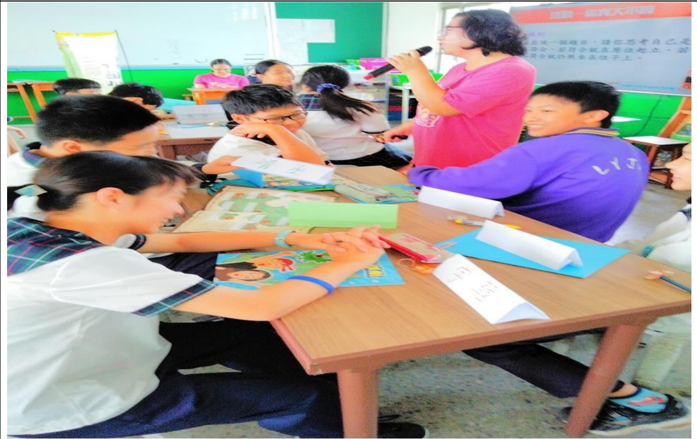
老師分享自己的生涯發展經驗