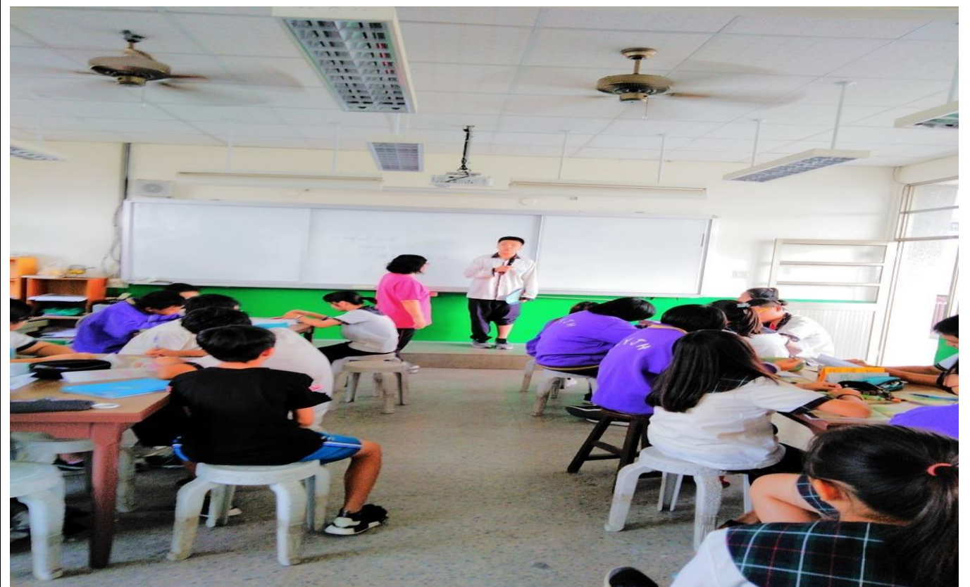
學生上台分享自己的夢想及如何實踐