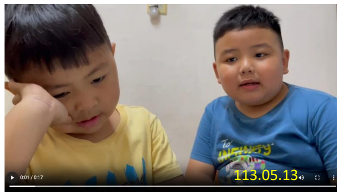
113. 5. 13 家長分享幼兒唸謠的影片