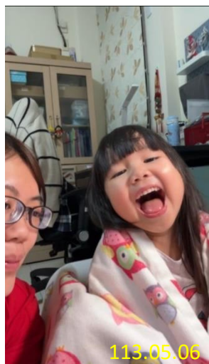
113. 5. 06 家長分享幼兒唸謠的影片