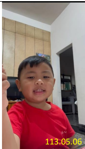
113. 5. 06 長分享幼兒唸謠的影片