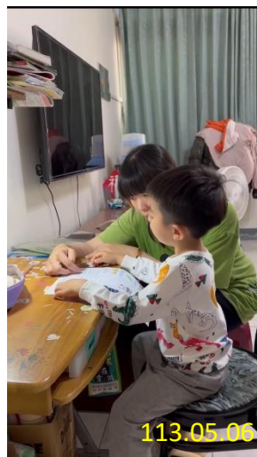
113. 5. 06 幼兒與媽媽共讀-閩南語學習單