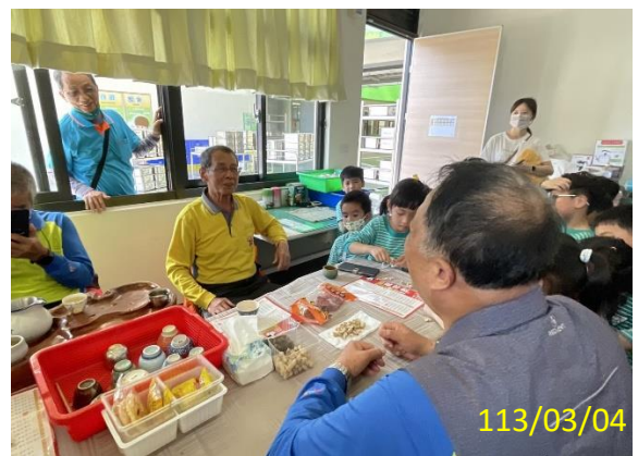
照片說明：和社區長輩吃土豆用台語互動