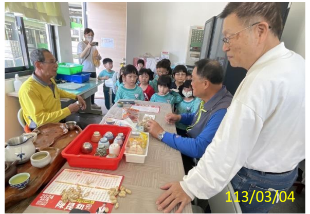
照片說明：和社區長輩吃土豆用台語互動