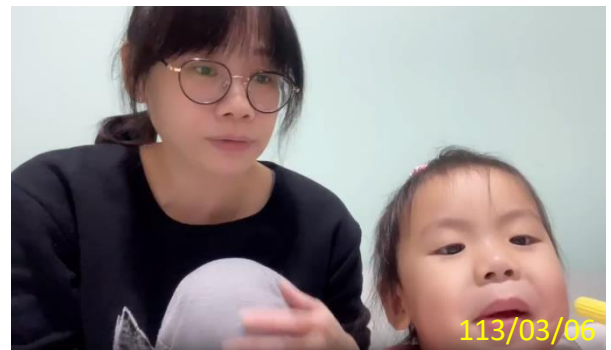
照片說明：家長分享幼兒唸謠的影片