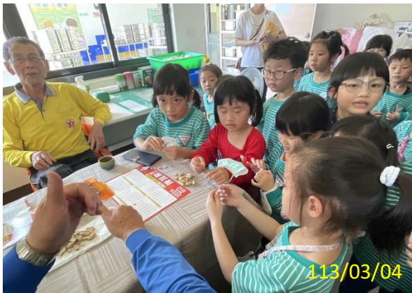
照片說明：和社區長輩吃土豆用台語互動