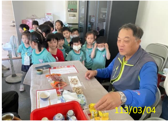
照片說明：和社區長輩吃土豆用台語互動