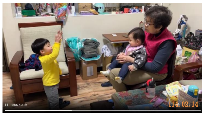
唱跳元宵節母語歌謠給奶奶與弟弟聽。