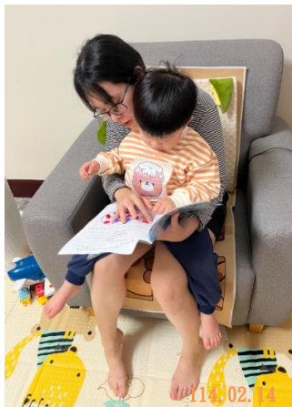
與家人一起分享元宵節母語學習單。