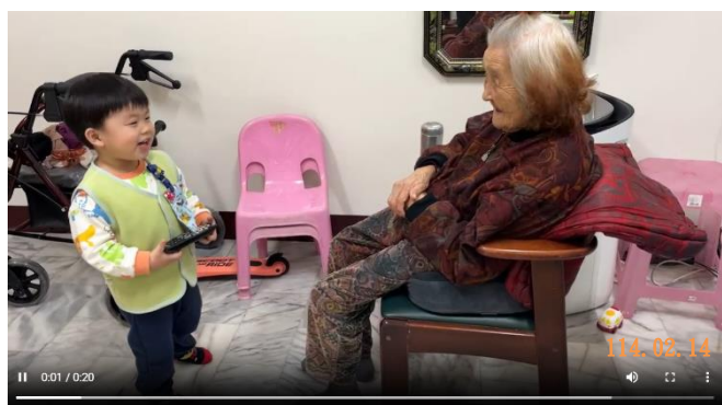
唱跳元宵節母語歌謠給祖母聽。