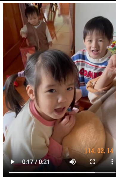
與家人一起分享元宵節母語歌謠。