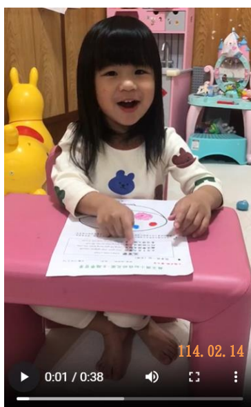
幼兒唸元宵節母語歌謠。