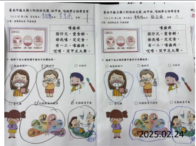
照片說明：幼兒操作正確的刷牙方法