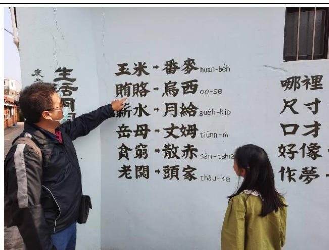
說明：走進社區尋找台語路