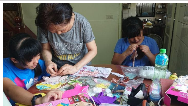
說明：祖孫情，時時樂