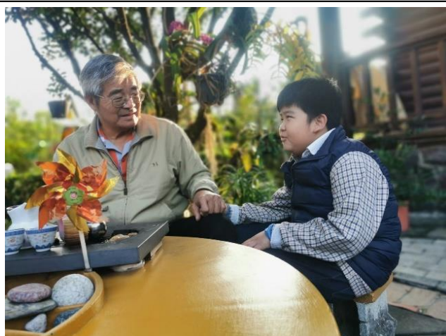
說明：祖孫講母語，阿公阿媽最歡喜