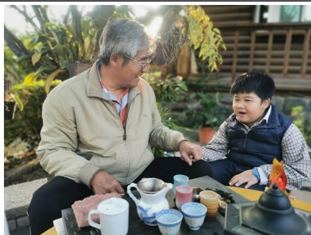
說明：用母語串起祖孫情