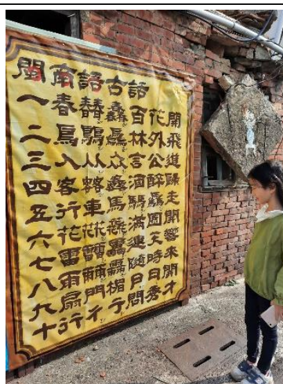
說明：親子走讀尋訪台語詩的智慧