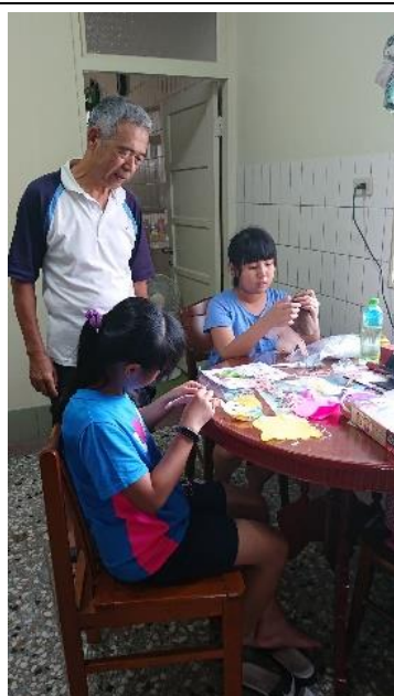
說明：用母語搭起祖孫之間的橋樑