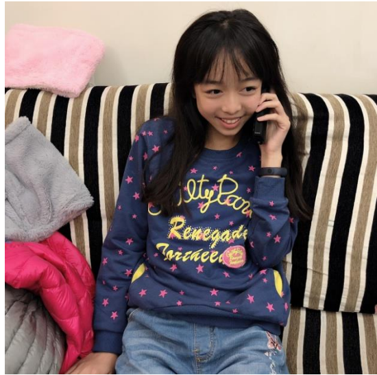
說明：以母語向家中長輩問好