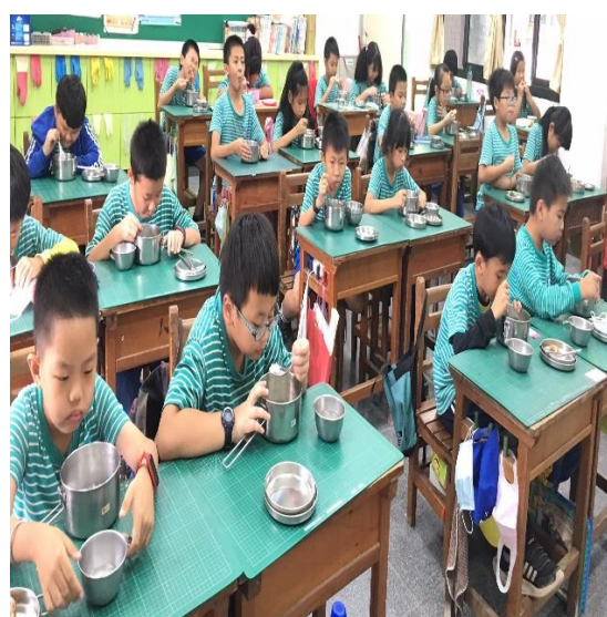
學生自備餐具可重複使用