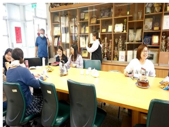
教師開會自備水壺或使用公杯，可重複使用