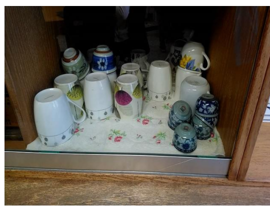
準備茶杯供來訪客人使用