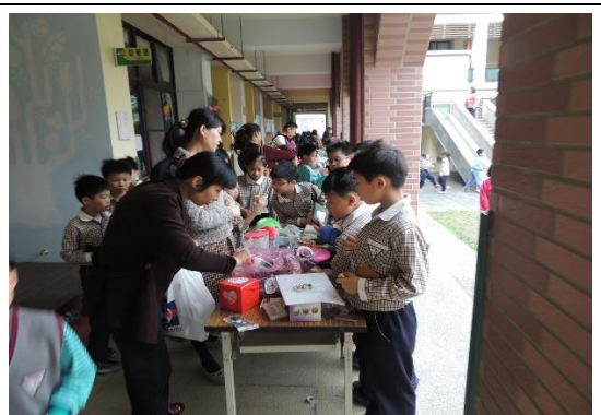
跳蚤市場(校舍重建時暫停，現校舍已完成將繼續舉辦)