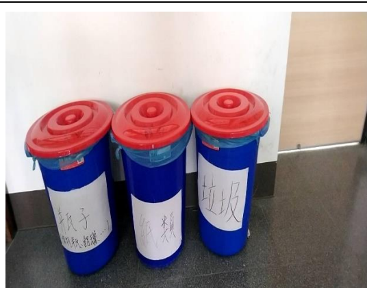
各班執行垃圾分類並資源回收