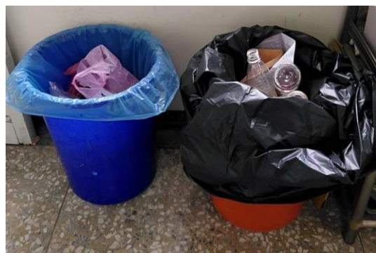
辦公室執行垃圾分類並資源回收