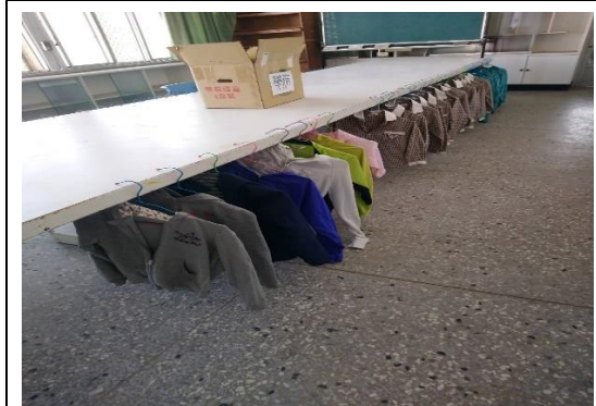
回收衣服供需要學生領用