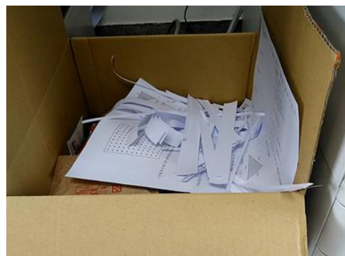
辦公室執行小型紙類回收