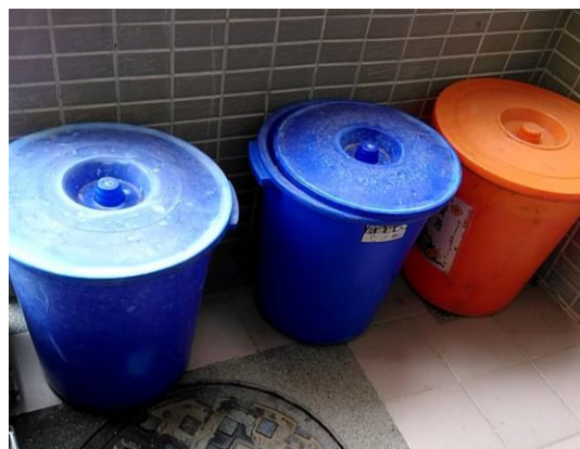
各班執行垃圾分類並資源回收