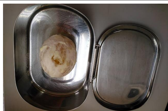
鼓勵用可重複使用容器裝食物