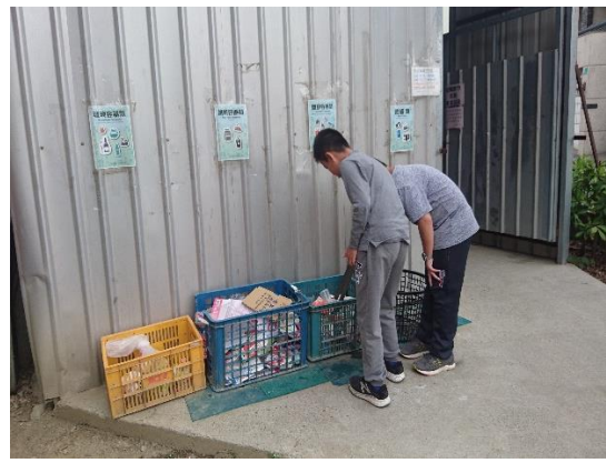
垃圾分類 (房間裡為一般垃圾)