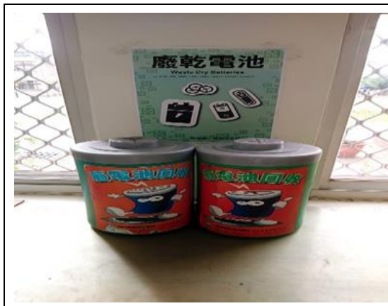
辦公室執行廢乾電池回收