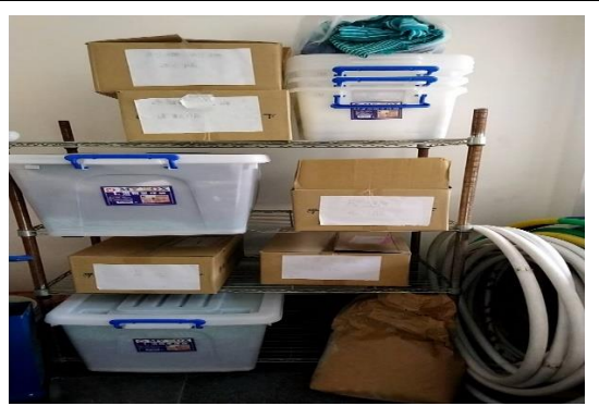
回收制服與運動服供需要學生領用