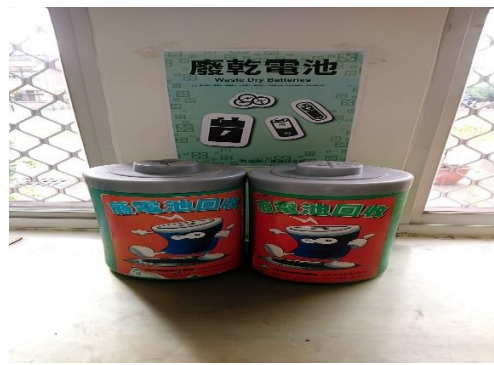
辦公室執行垃圾分類並資源回收