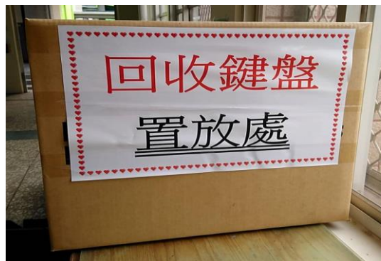
辦公室執行垃圾分類並資源回收