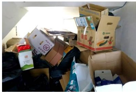
分類回收，每月底整理大型紙類回收