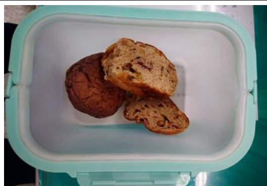
鼓勵用可重複使用容器裝食物