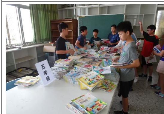
教科書回收再利用