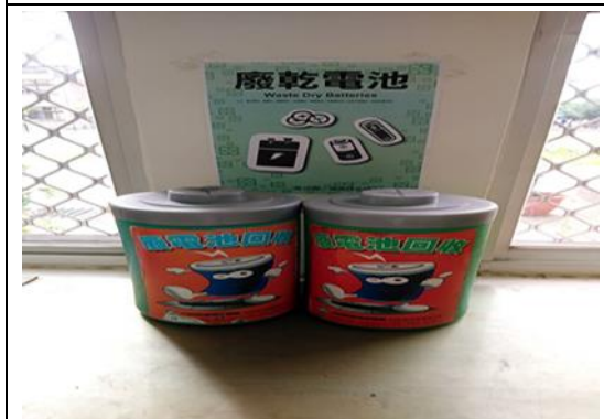
辦公室執行廢乾電池回收