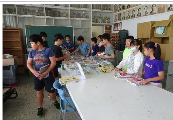
教科書回收再利用