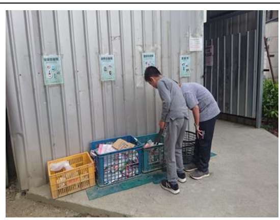
環保小尖兵確認分類回收是否正確