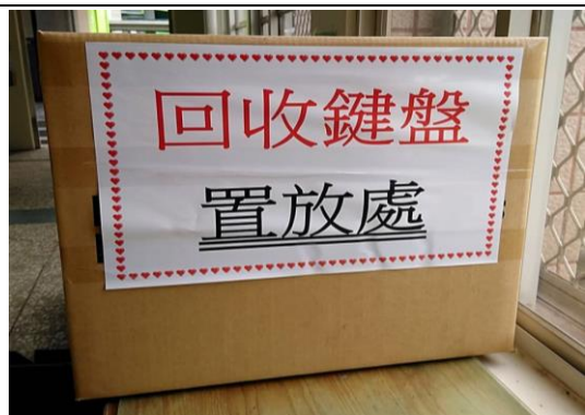
辦公室執行垃圾分類並資源回收