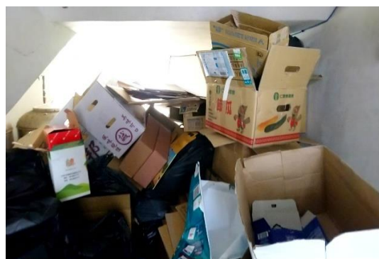
每月底整理大型紙類回收