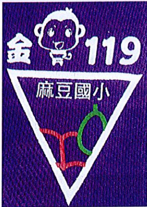
119 年校慶標誌 Logo