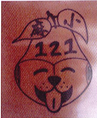
121 年校慶標誌 Logo