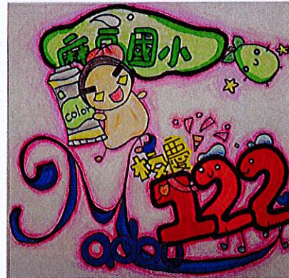
122 年校慶標誌 Logo