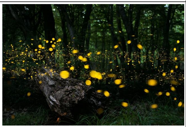
尖山埤螢火蟲棲地夜觀