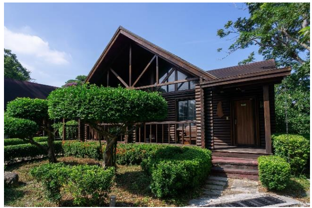
尖山埤小木屋-環保旅店