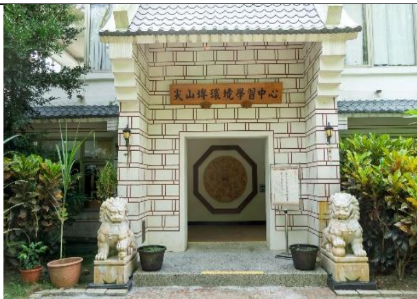
尖山埤環境學習中心