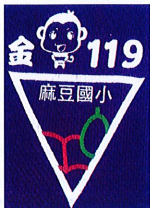
119 年校慶標誌 Logo