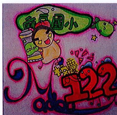
122 年校慶標誌 Logo