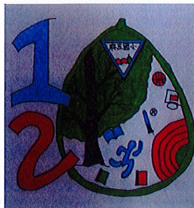
120 年校慶標誌 Logo