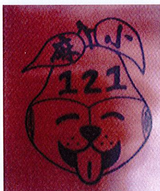
121 年校慶標誌 Logo