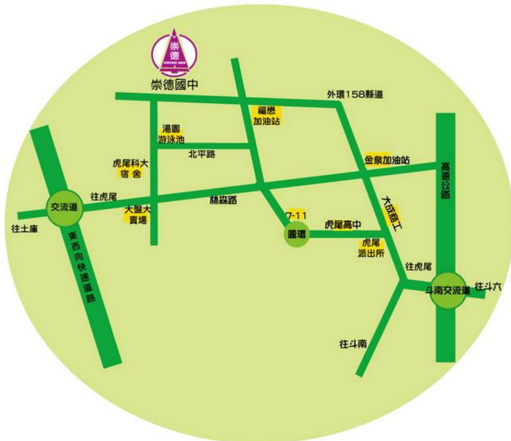
【雲林縣崇德國中位置圖】