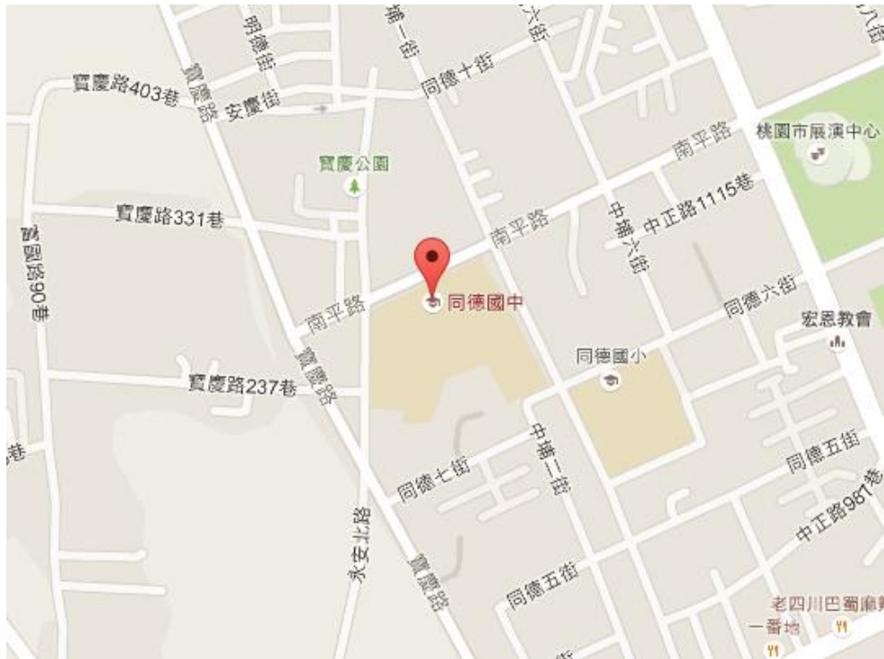
【桃園市同德國中位置圖】