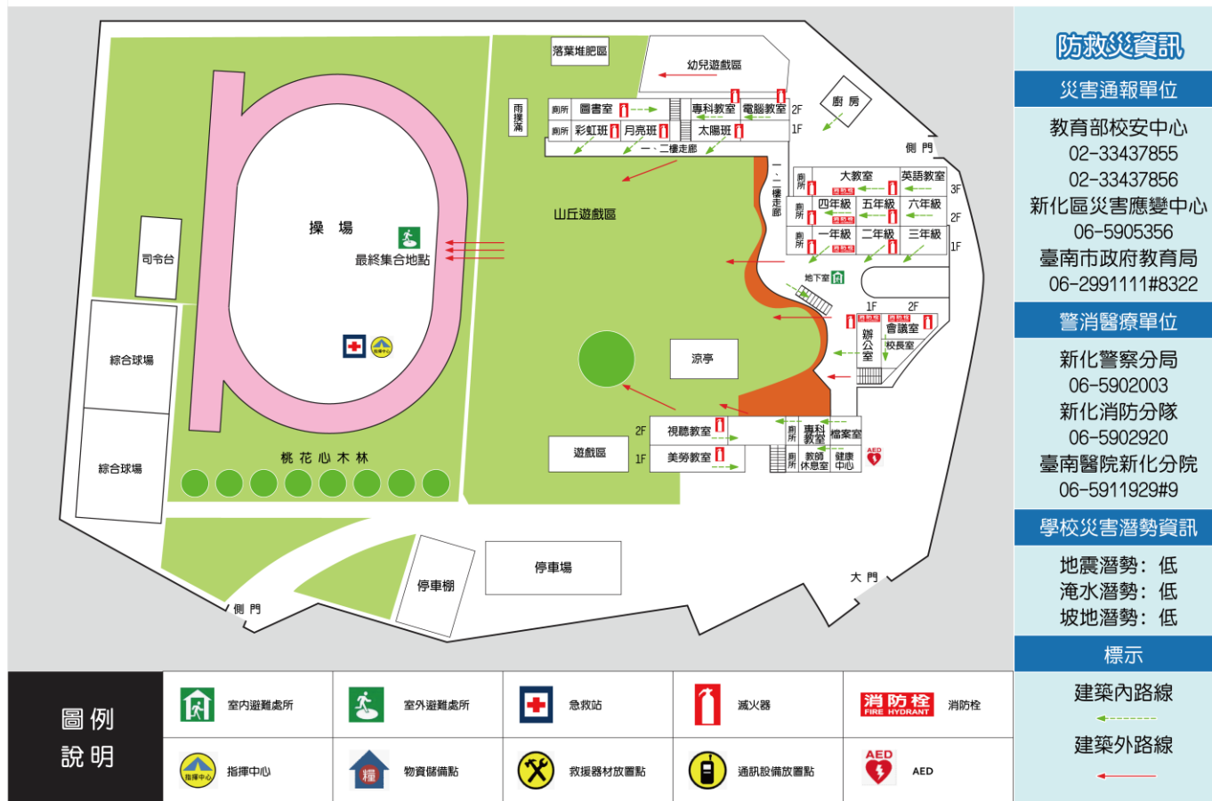
臺南市那拔國小緊急避難疏散地圖