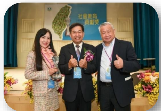
2021年由教育部潘文忠部長頒授 「社會教育貢獻獎」肯定

「旺宏科學獎」強調創新，希望打造公平公正公開的競賽平臺，並透過高額獎學金制度，激發每位參賽同學的創意潛能。期許未來能持續影響年輕世代勇敢天馬行空，務實動手實踐，厚植臺灣基礎科學實力。