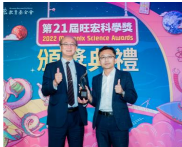
教育部次長林騰蛟多次出席活動，並鼓勵獲獎學校