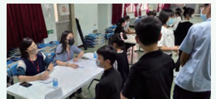
建教合作廠商面試