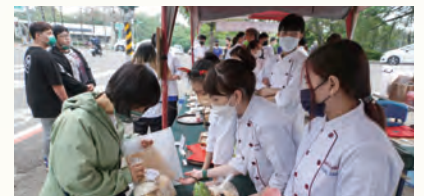
畢業成果展-伴手禮市集