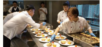
學生辦理感恩餐會