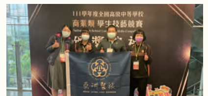
商業類科技藝競賽雙優勝