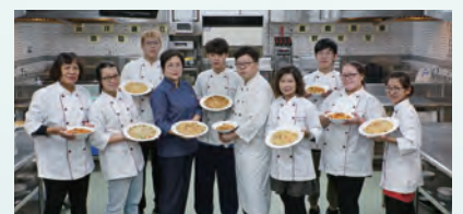
晶英酒店主廚業師協同教學