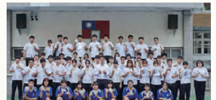
4張以上證照達人合照