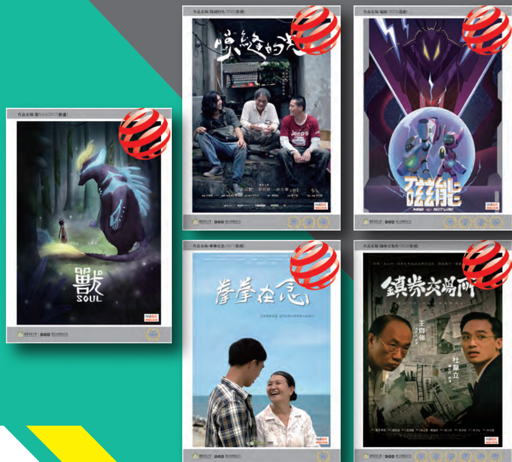
● 榮獲德國紅點設計獎項作品