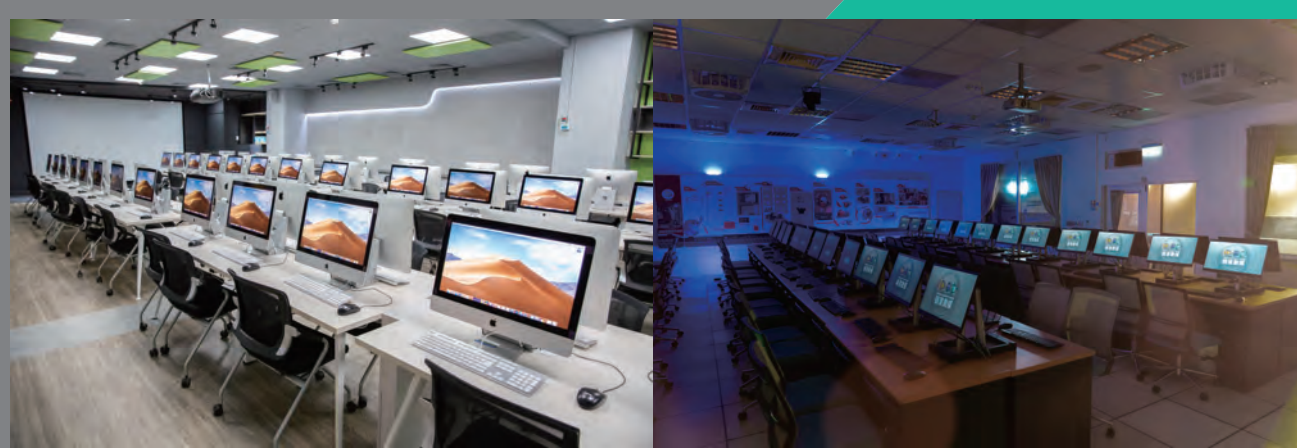
▶▶ MAC 影視特效後製電腦教室

● 本系與許多影視傳播、電腦動畫、電腦遊戲、AR 擴增與 VR 虛擬實境業者均有密切產學合作關係，如東森媒體集團、三立電視、民間全民電視、mono 親子台、台中捷運公司、映畫傳播、福相數位電影製作、凌雲傳播、乾坤一擊創意工作室、龍特創意、沌與設計、果思設計工作室、... 等，未來將繼續加強產學合作，與更多業者建立夥伴關係。