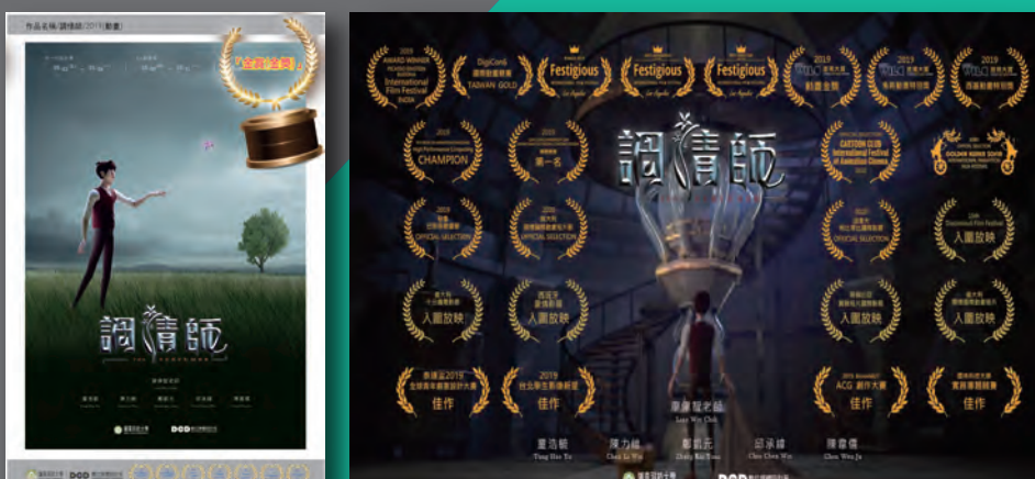
● 「調情師」3D 動畫學生作品屢創佳績，榮獲國內外多項比賽金獎、第一名、... 等