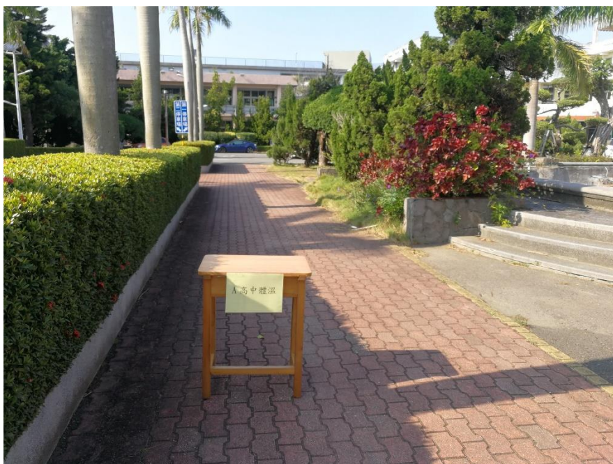
高中部學生檢測站