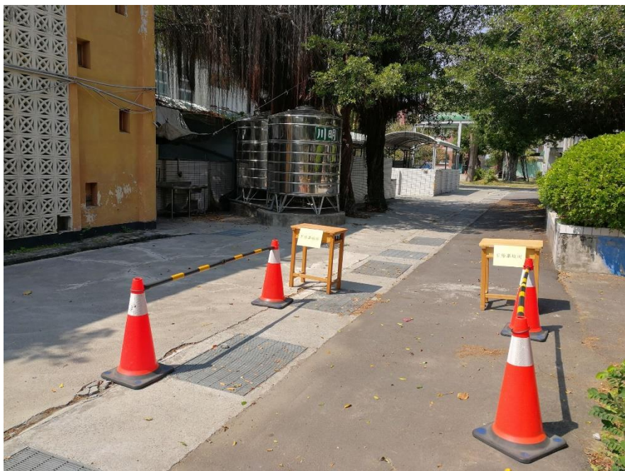
學生腳踏車檢測站