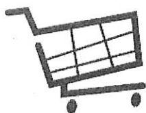
個人花費及2-3次 街市探訪自費餐