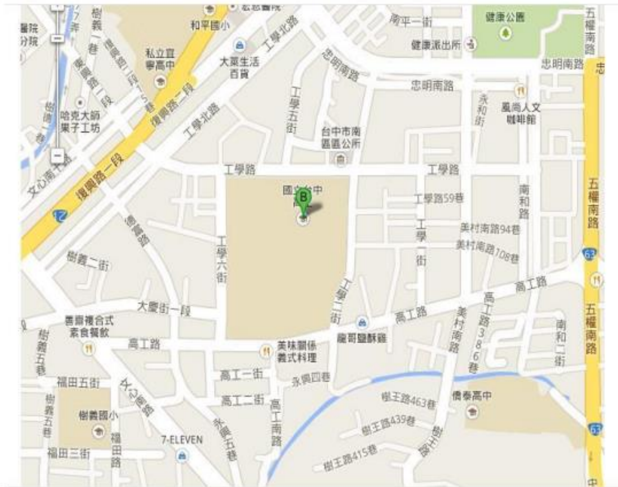
國立臺中高工交通位置圖