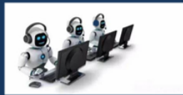
OPENVOICE 僅需10秒樣本即可語音複製