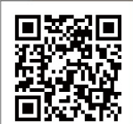
國中教育會考 試場規則