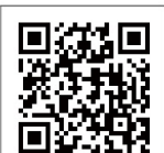
國中教育會考 違規處理要點