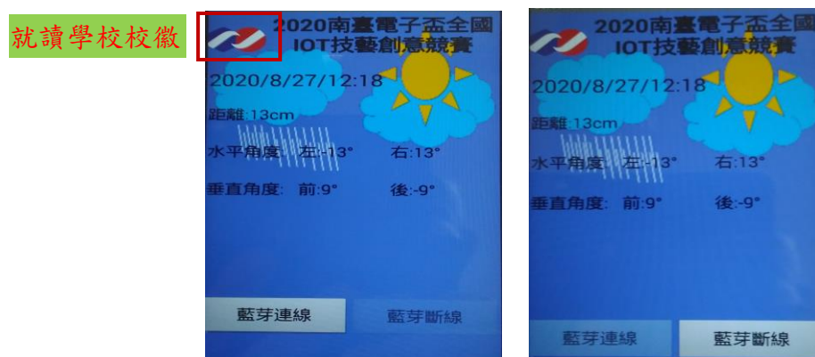
圖 2、手機顯示畫面，左-藍牙連線、右-藍牙斷線的功能選項[顯示畫面為參考用]