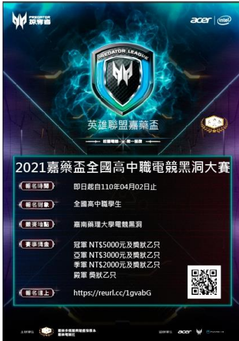
附圖一 主視覺、活動海報

主辦單位保留對此份賽事規章的增加/刪減條文權力以及最終解釋權，亦保留補充 此份賽事規章的權力。