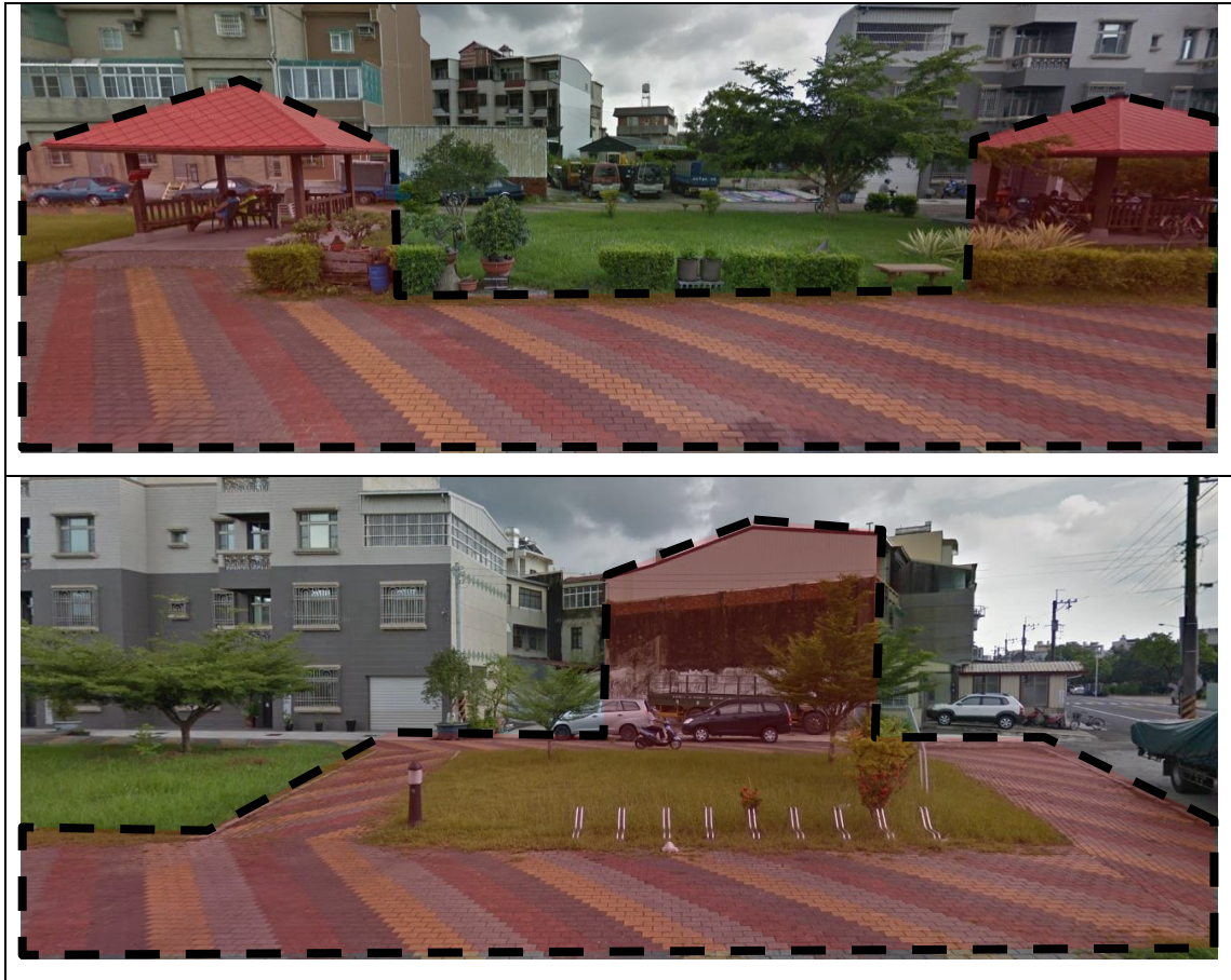
圖 5、彩繪建議位置圖(確切位置可自訂)