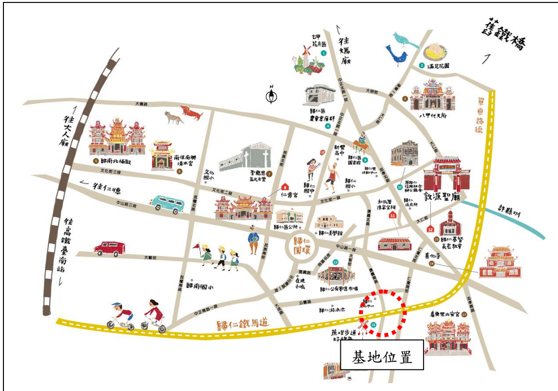
圖 1、歸仁自行車鐵馬道範圍圖