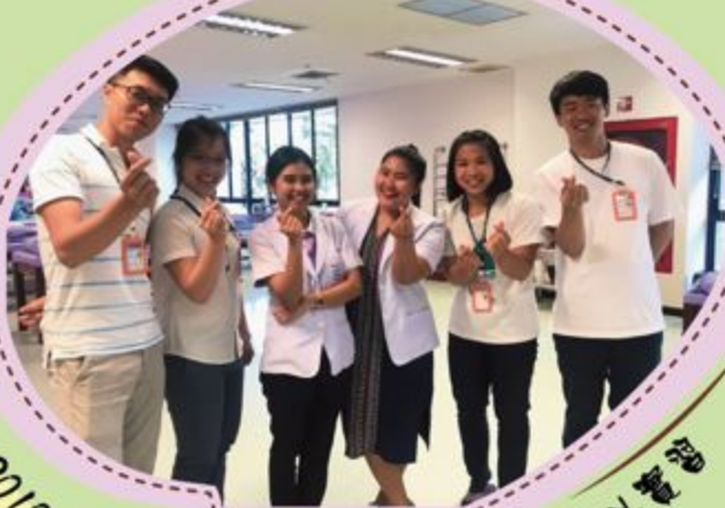
2018年本系學生赴泰國馬希賓大學海外實習