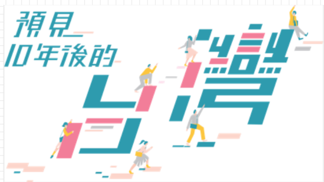
2018 遇見十年後的自己