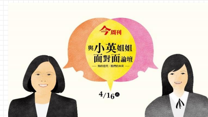
2016 妳的世代 我們的未來