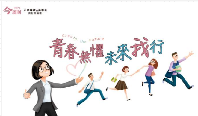
2021 青春無懼 未來我行

以不同趨勢議題、不同互動方式呈現，是全國高中生年度盛事！能夠充分表現自己的最佳論壇！