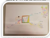
心智圖社會科筆記練習