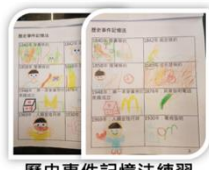
歷史事件記憶法練習