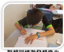
聯想訓練激發想像力