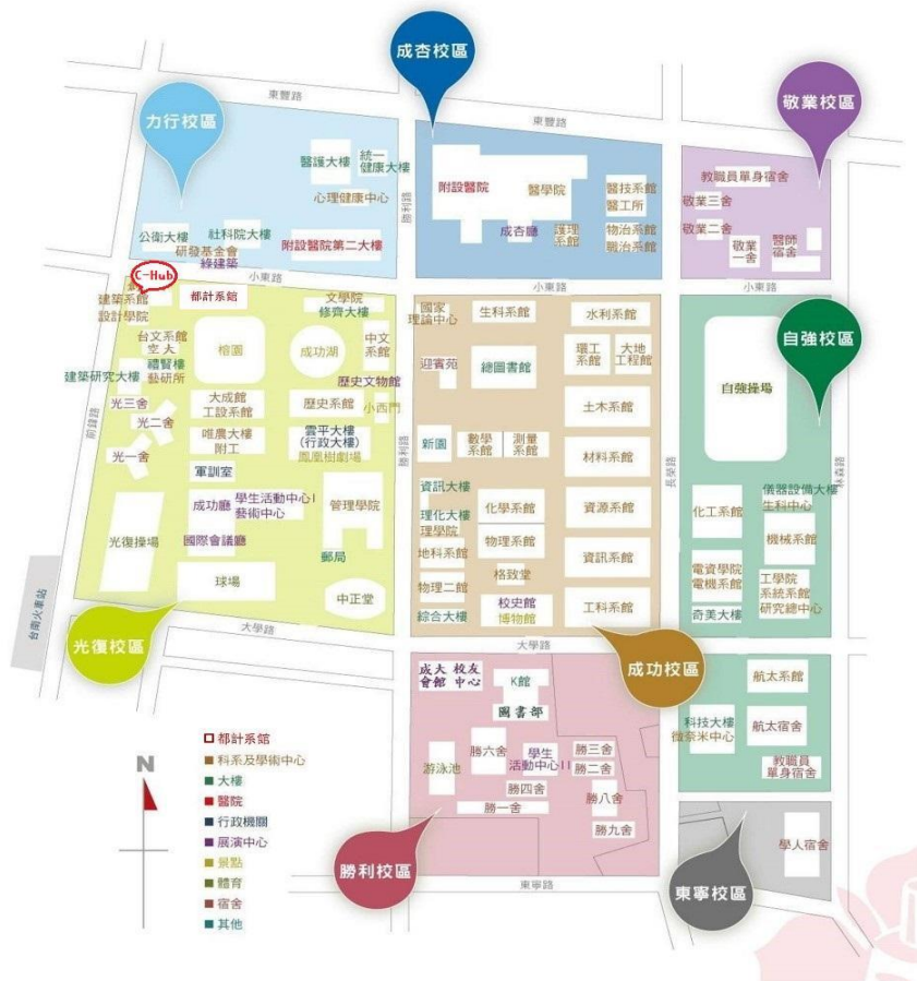
圖 1-C-Hub 創意基地位置圖