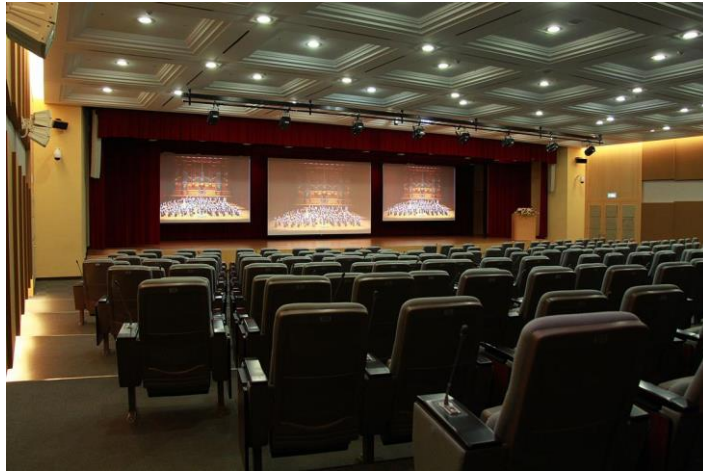
圖 1、張榮發基金會國際會議中心 1101 廳場地示意圖