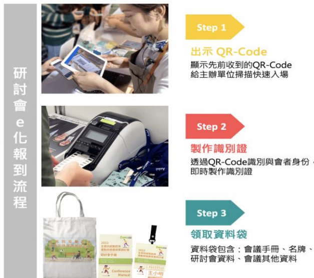
圖 3、研討會 e 化報到流程示意圖