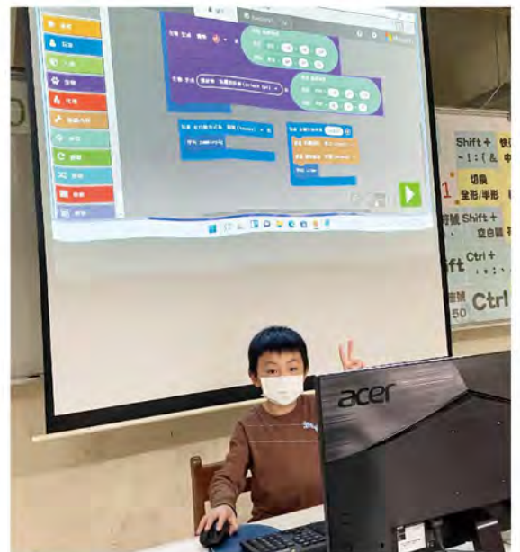
我來分享麥塊積木程式！