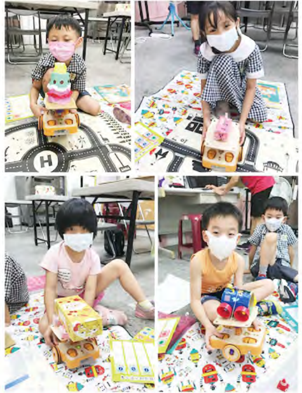
這是我們製作的 ~「夢想跑車」~