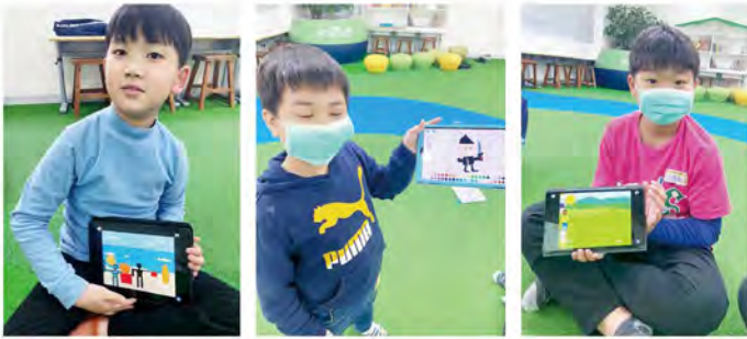
環保淨灘 天才畫角色 太陽出來了