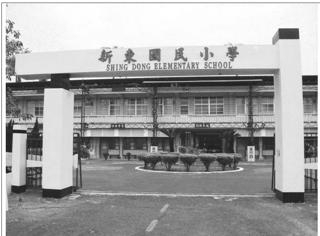
【圖1.2.5】新東國小校門口