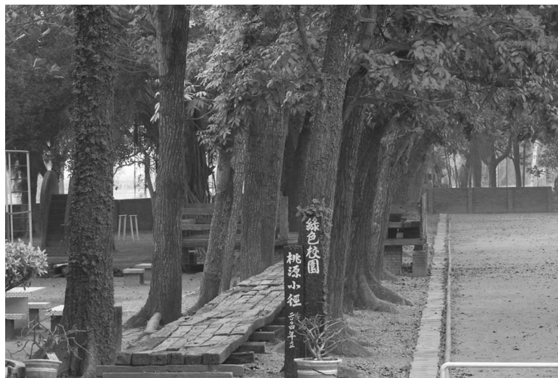
【圖1.2.6】新東國小校內「綠色校園桃源小徑」