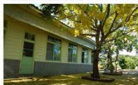
恣意盛開的阿勃勒配上古意味濃的日式辦公室，令人神遊翻騰的歷史