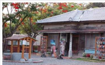
新東國小的日式校長宿舍與日式辦公室

文化力才是真正國力的表徵，往往文化資產的豐富，比外匯存底的數額更重要，也比科技產物來得持久與永續。很慶幸新東國小具有日式宿舍這樣的文化資產，而我們要怎樣透過這樣的歷史文化資產給我們的下一代鑑古知今想未來呢？值得深思！