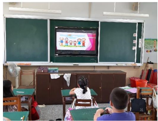
利用多媒體輔助教學，引導學生思考