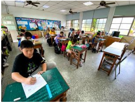
引導學生試著表達想法