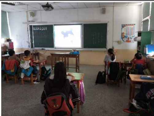
利用多媒體引導學生