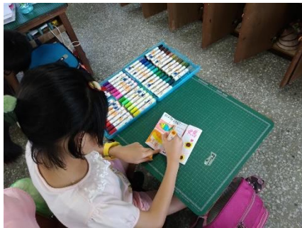
學生發揮創意，表達想法