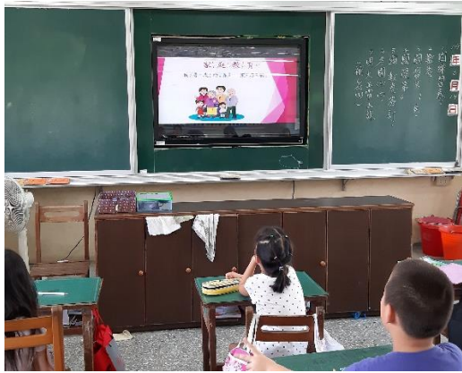
利用多媒體輔助教學，引導學生思考