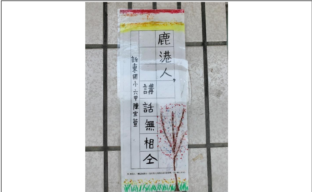
走廊台語諺語布置