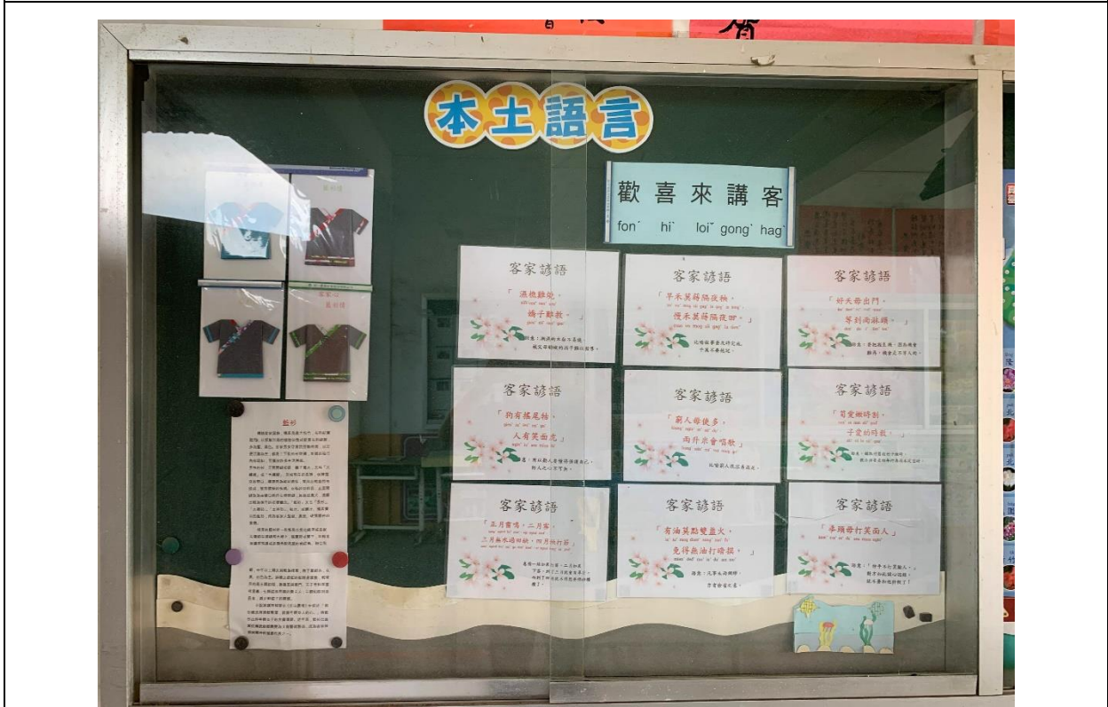
公布欄-客語文化布置