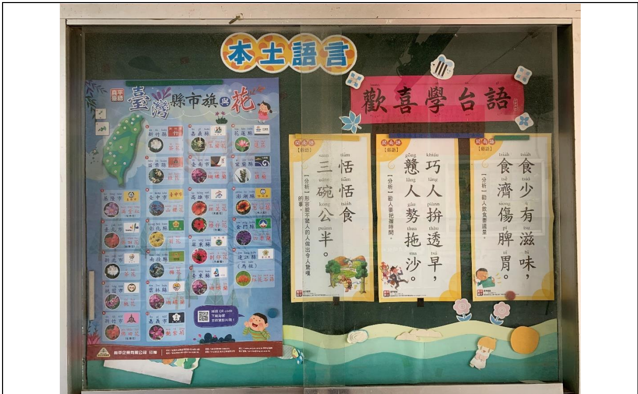
公布欄-台語文化布置