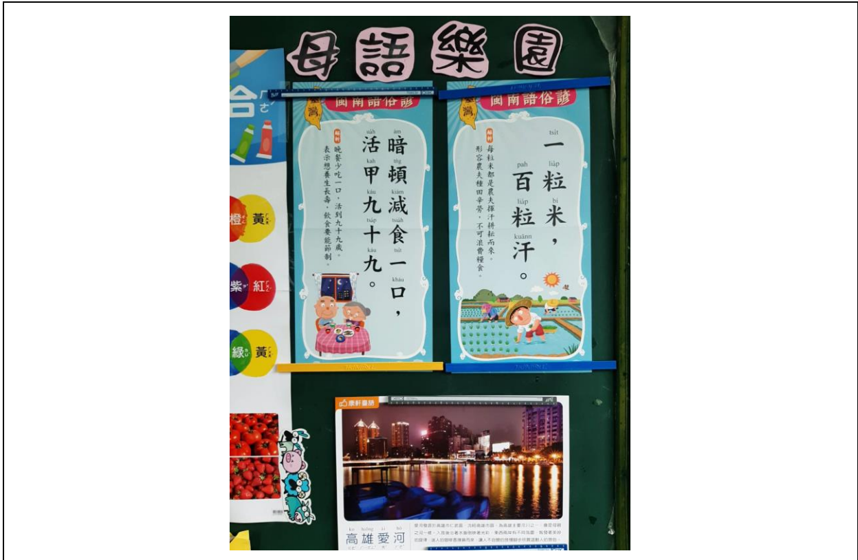
各班母語環境布置