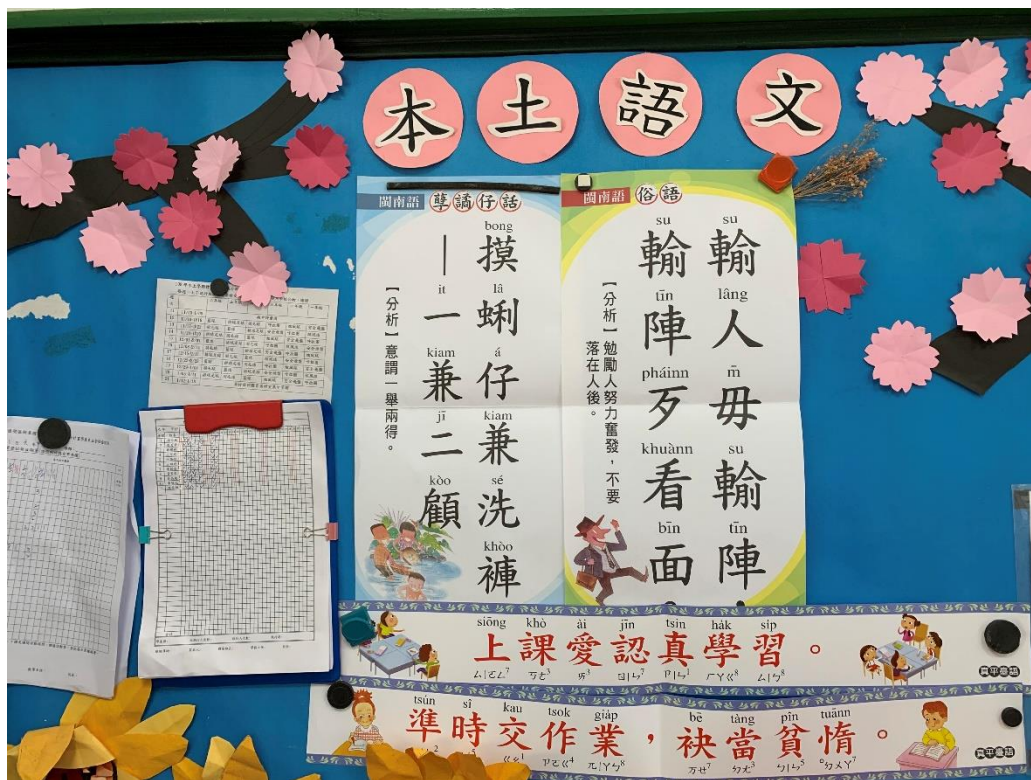
各班母語環境布置