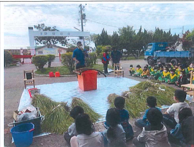
說明：結合在地小農介紹在地農作物