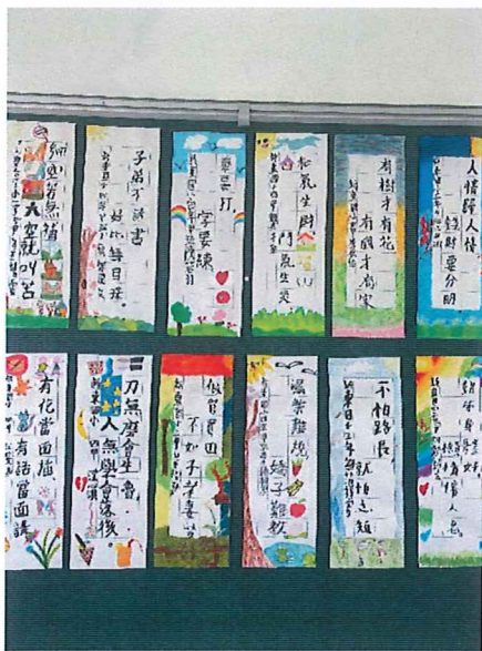
說明：書法創作本土俚語布置班級情境