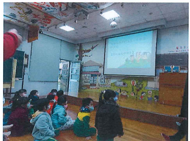
說明：世界母語日大家來臆謎猜