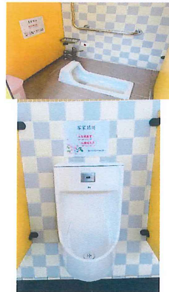
說明：客家諺語廁所情境布置