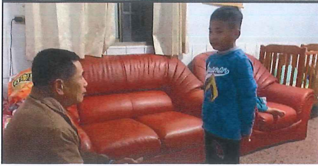
說明：唱首母語歌給家人聽 (搭配 classroom 作業繳交互動影片)