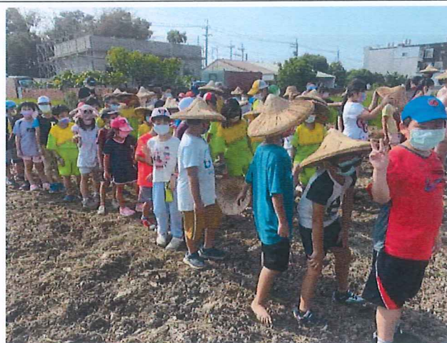
說明：到學校夢想田體驗農事了解在地文化