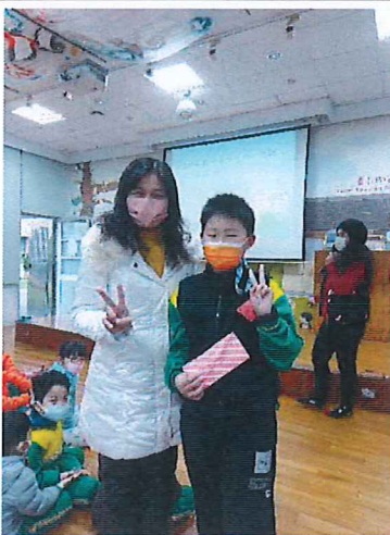
說明：分享阿美族族語學習心得獲得校長獎勵