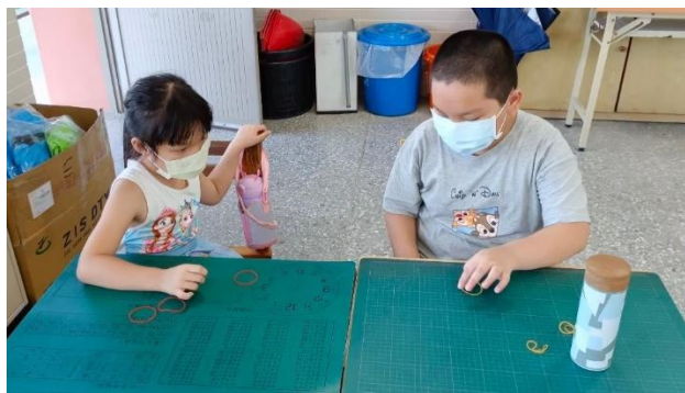
說明：越南兒時小遊戲體驗