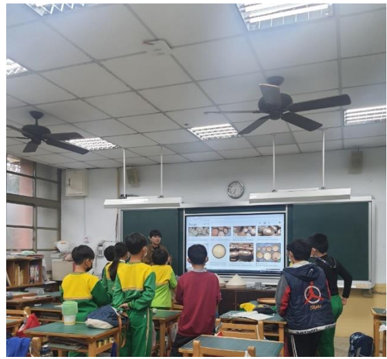
說明：認識越南斗笠和竹籃的使用方式