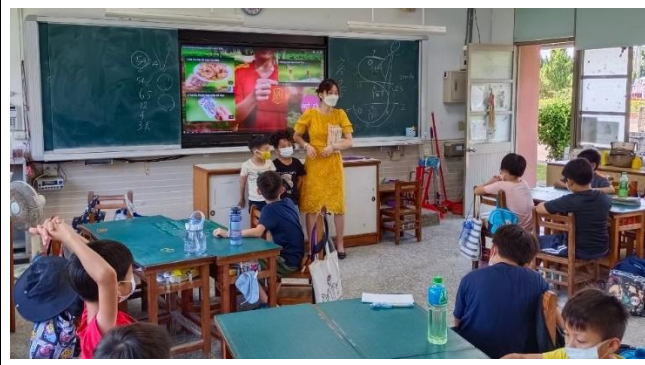
說明：越南美食介紹