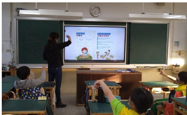
說明：邊書空邊練習正確發音