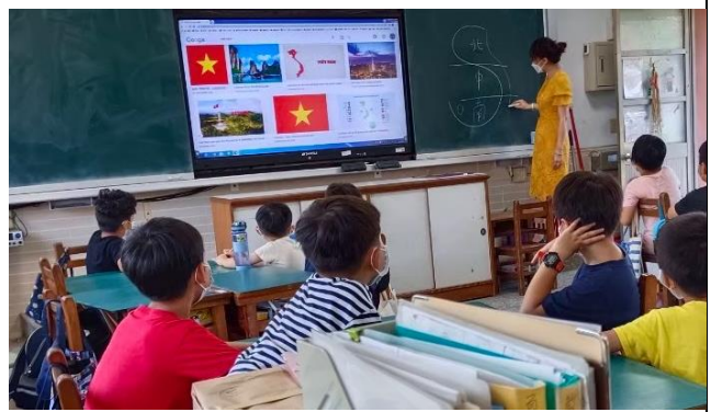
說明：認識越南的地理位置