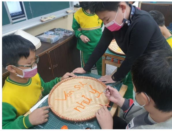
說明：彩繪越南斗笠和竹籃