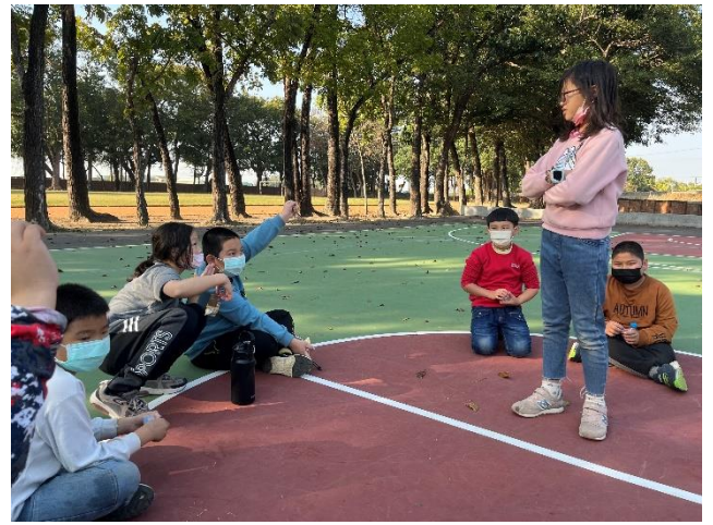
說明：戶外閩南語小遊戲，幫助學生口說練習