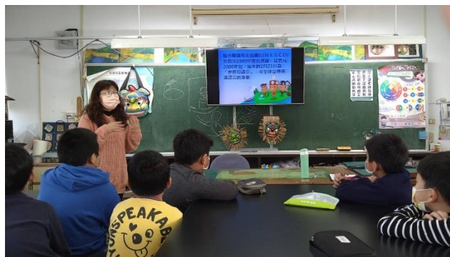
說明：教師課堂中宣導221世界母語日