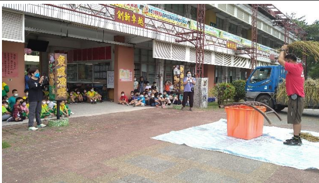
說明：結合在地小農介紹在地農作物