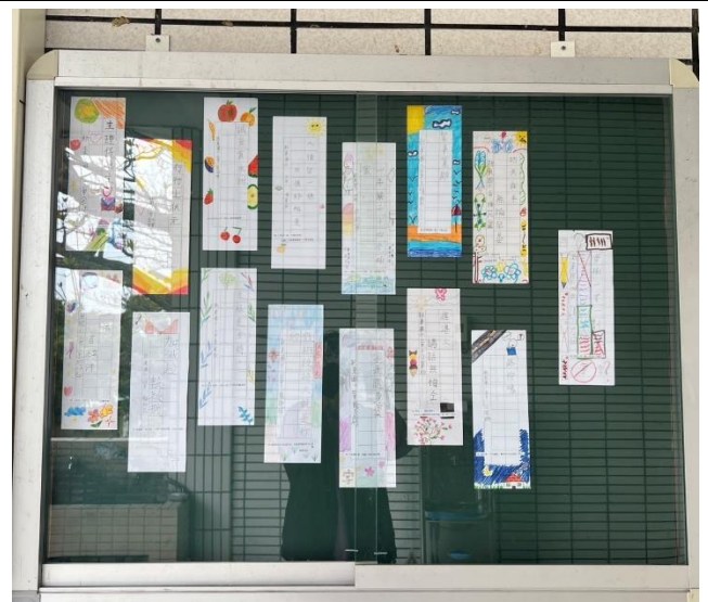
說明：書法教室閩南語諺語情境布置