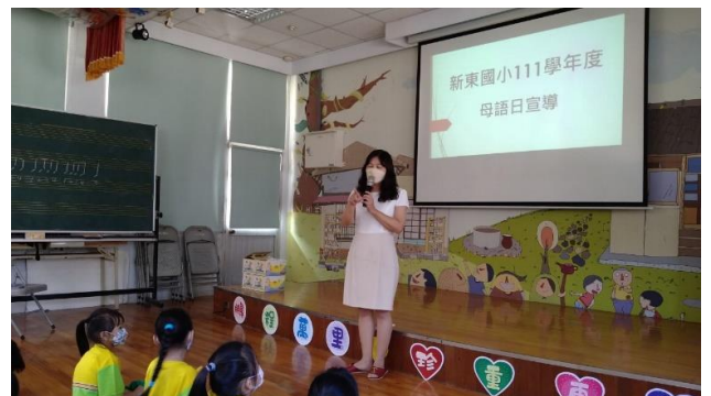
說明：校長獎勵用心學習本土語言的學生