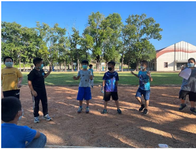
說明：動態閩南語話劇練習