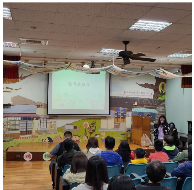
說明：親職講座說明本校本土語言的課程