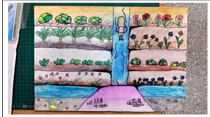
說明：魔法一頁書的作品