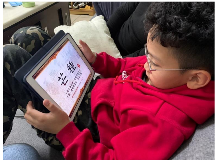
說明：在家以線上進行母語自主學習