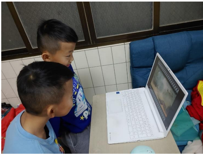
說明：雙胞胎兄弟寒假在家觀看節目學習