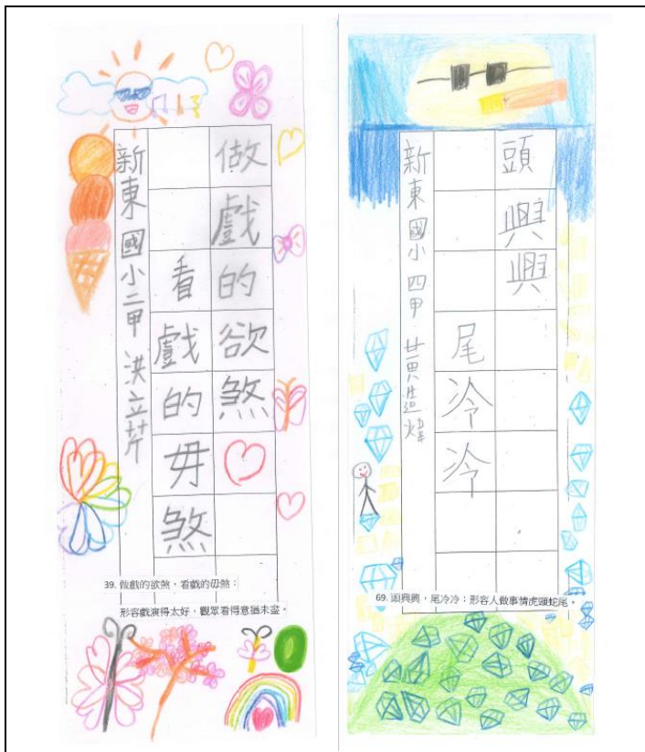
說明：書法課程硬筆字的練習時，學習閩南語諺語