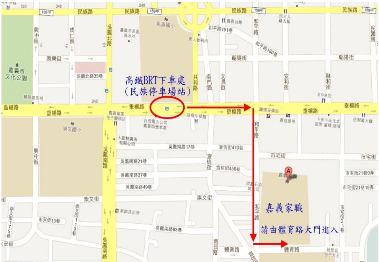
附圖一 承辦學校位置圖