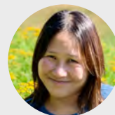
哈佛 Project Zero 計畫主持人 Flossie Chua

雙橡教育 始終相信學習是有用、有趣、有意義的事，它能讓人找到安身立命的工作，有能力打造自己的未來。雙橡自 2017 年起，開始往芬蘭、哈佛取經，打造出許多結合東西方特色的專案課程，因而獲親子天下創新 100，並啟動多個社會影響力活動，包含 See Think Wonder 思考挑戰賽 。