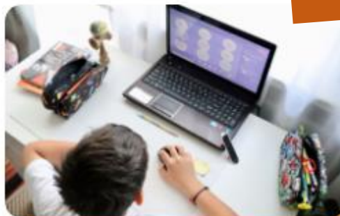
網路課程 - OnO