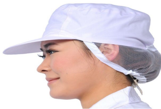
↑ 衛生帽：頭髮要完全包覆在帽內。