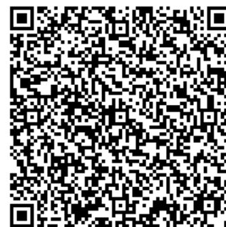
新營高中 GOOGLE MAP