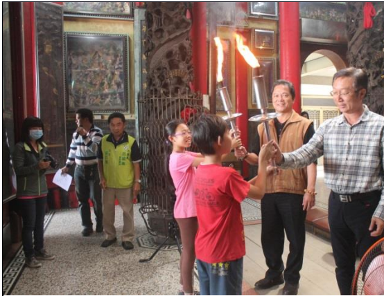
說明：校長遞交聖火給學生代表