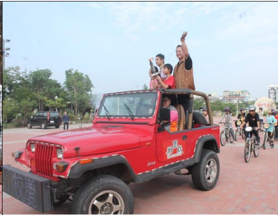
說明：校長及家長委員與本校學生騎乘腳踏車繞行社區