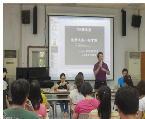
說明：校長說明健促推行的重要