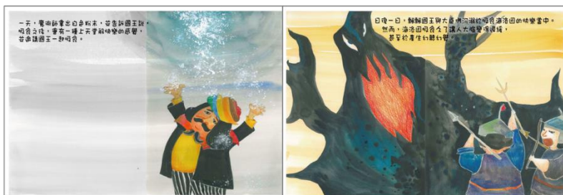
※範例作品：教育部反毒繪本—山茶花婆婆/洪孟真、呂舒婷