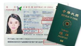
有效期限內護照正本