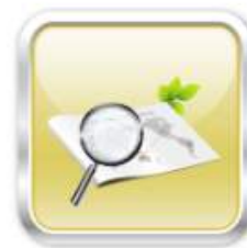
認證資料以及狀態查詢